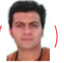
ا احمد طالبی | خبرنگار

سرمایه‌گذار عمارت صدر اعظم از مشکلات جدی بوروکراتیک و اداری در طول پنج سال مرمت این بنا صحبت می‌کند که روند کار را به شدت کند کرده و هزینه‌ها را افزایش داده است