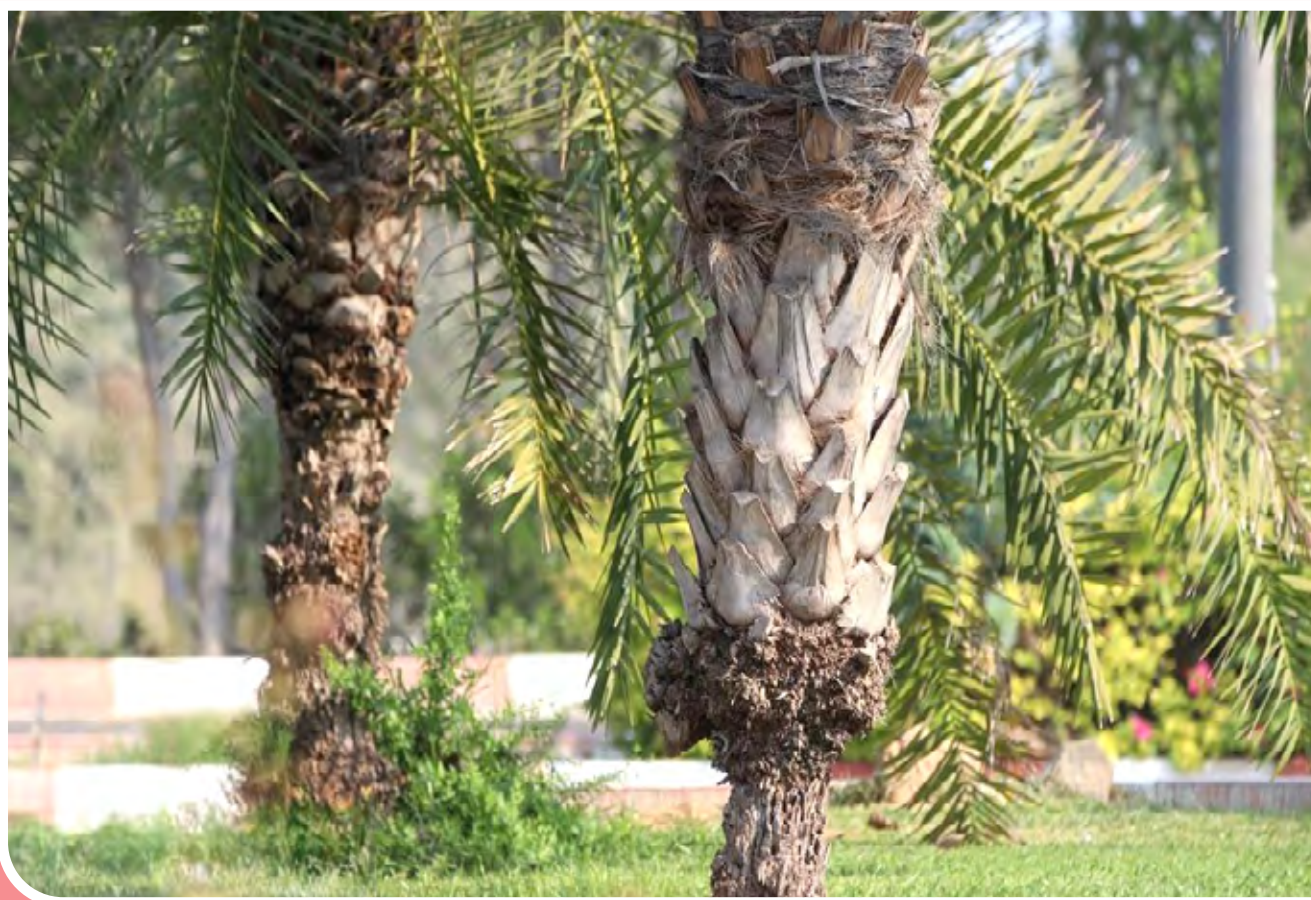
پوسیدگی نخل و شکستن تنه و تاج آن، عارضه‌ای است که بر اثر ابتلای درخت به قارچ تیلایویوسپیس اتفاق افتاده و پس از آسیب به قسمت‌های مختلف، در نهایت موجب مرگ درخت می‌شود. اکنون نخل‌های کیش به‌دلیل این موضوع در حال مرگ هستند.