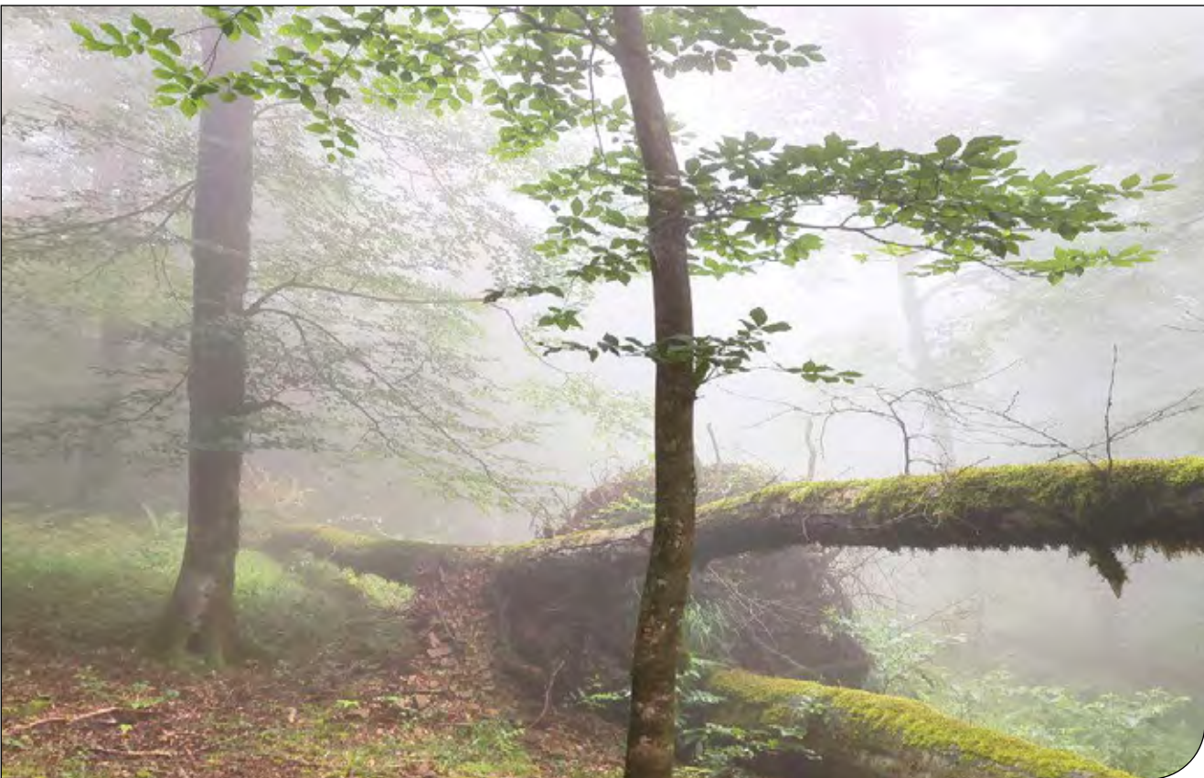
جنگل هیرکانی در استان آذربایجان شرقی

مقایسه جنگل‌های طبیعی هیرکانی با جنگل‌های دست‌کاشت اروپا و نتیجه‌گیری‌های غلط ناشی از آن، باعث درک نادرست از وضعیت جنگل‌های شمال ایران و تلاش برای تغییرات غیرضروری در این زیست‌بوم‌ها شده است