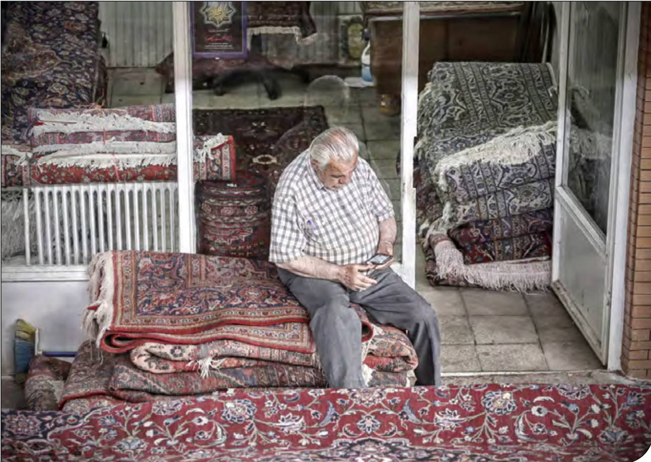
گزارش تخصصی از رکود فرش دستباف ایران: علل و راهکارها از نگاه کارشناسان