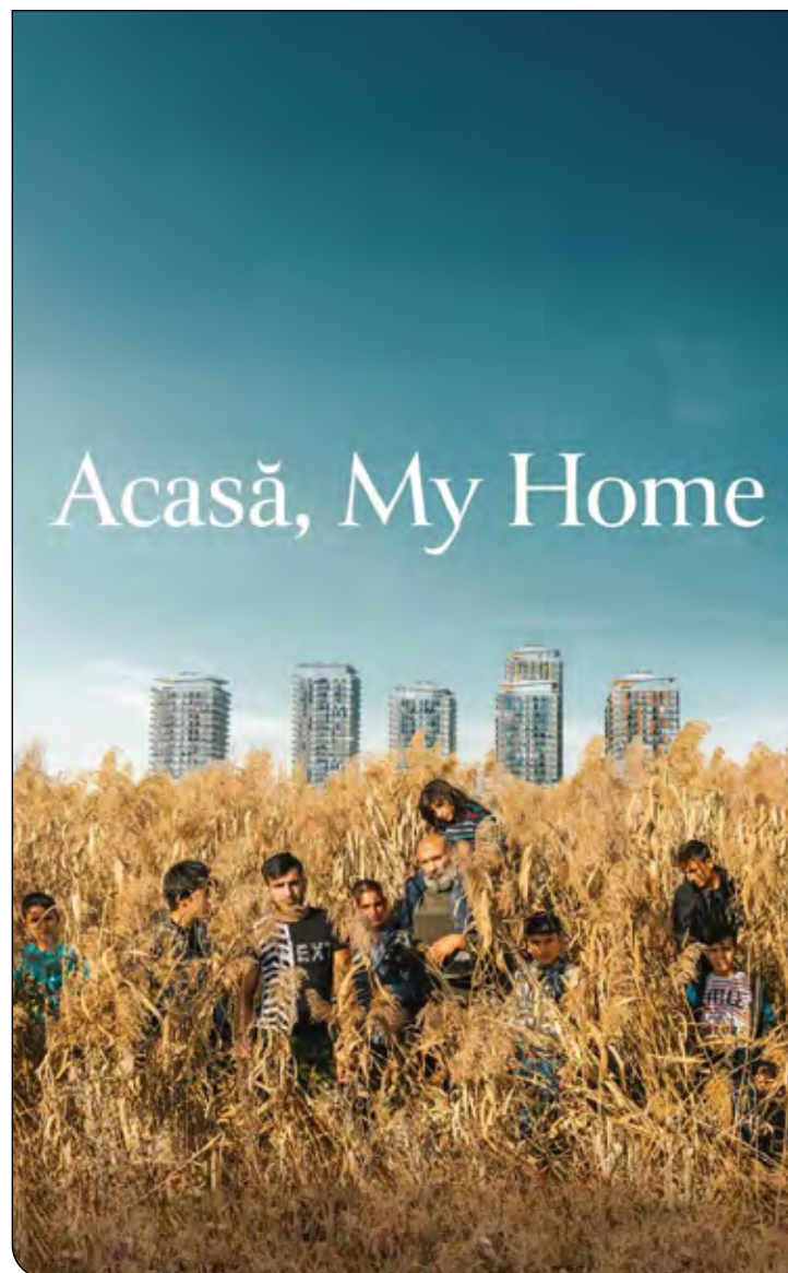
یک اکوتون (مرز یا منطقه‌ای با ویژگی مشخص که بین چند بیوم قرار دارد) است. در اینجا با یک اثر کاملاً متفاوت روبه‌رو هستیم؛ یک فیلم خاص که حاصل پژوهش یک روزنامه‌نگار محلی است که به مدت چهار سال در یک برنامه اجتماعی تدوین شده و راوی یک خانواده غیرعادی در جهان مدرن است.

پرداختن به موضوع حاشیه‌نشینی یک سوژه جذاب برای اهالی سینماست، اما رسیدن به یک خوانش انسانی کار هر فیلمساز نیست. در مستند کارگردان موفق شده است با استفاده از چیدمان خود خانواده و شرایط آنها به یک فیلم کالت برسد؛ ساختن اثر در یک منطقه بسته و متروکه و خانواده‌ای که بیش از دو دهه در حاشیه ماندن را زیست کرده‌اند، نیاز به یک جهان‌بینی متفاوت دارد. مستند به محیط‌زیست شهری هم پرداخته، اما موضوع اصلی آن چالش زیستن یک خانواده است که می‌تواند نمادی از یک اکوتون باشند.