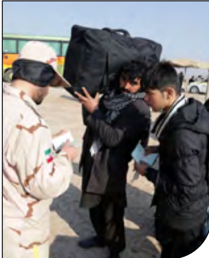
صفحه سفرنامه خوانی

مشاور وزیر کشور و رئیس مرکز امور اتباع و مهاجرین خارجی وزارت کشور گفت: اشتغال و اقامت اتباع افغانستانی حتی به صورت کوتاهمدت در مازندران ممنوع است و اتباع اهل این کشور فقط با ویزای گردشگری می‌توانند به این خطه از شمال کشور سفر کنند.