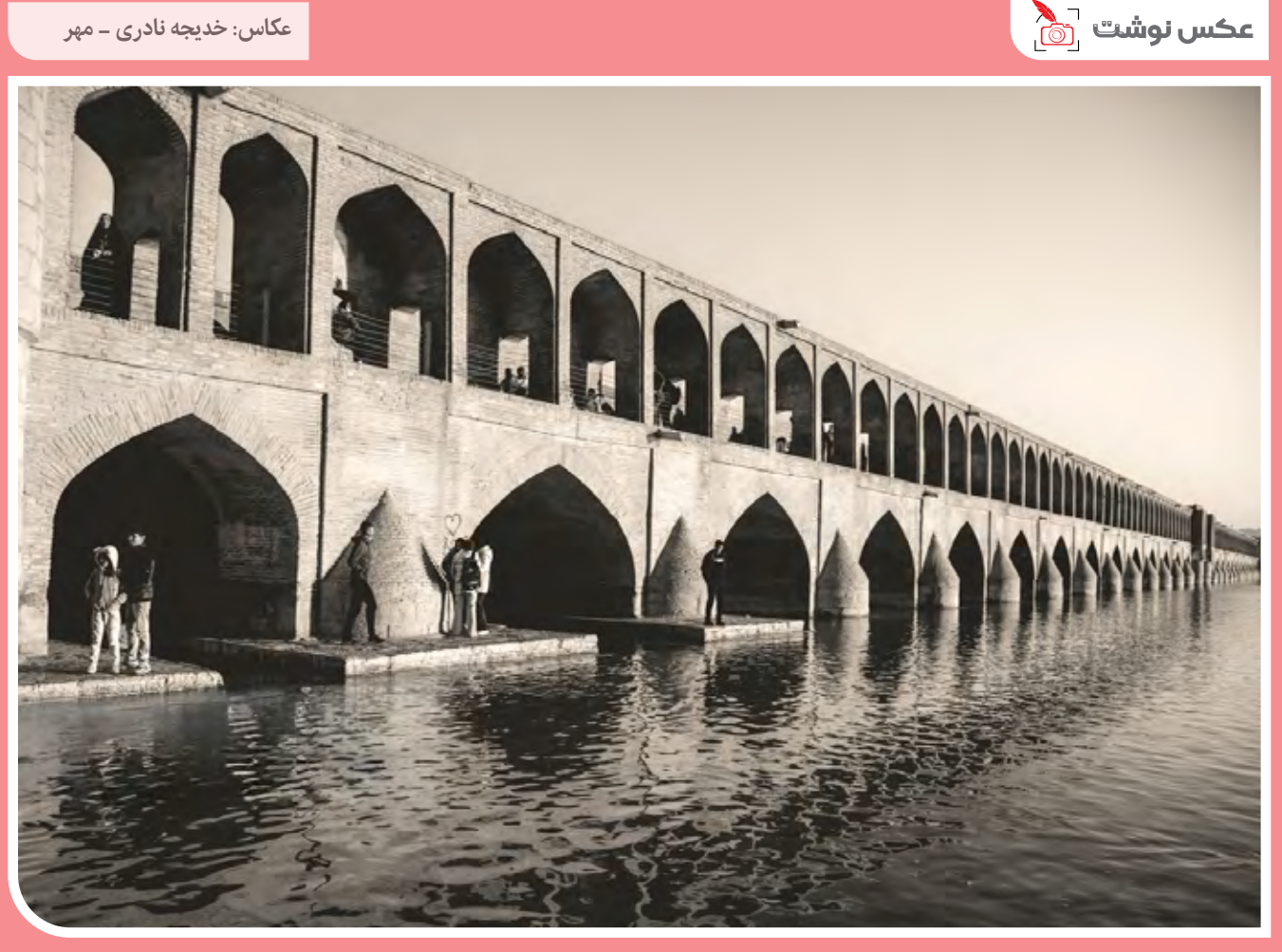
زاینده‌رود از برجسته‌ترین نمونه‌های میراث فرهنگی کشور ایران و دارای اهمیت تاریخی و حیاتی است. این رودخانه در سال‌های اخیر با مشکل خشکسالی، بحران‌های محیط‌زیستی و مدیریت غلط روبه‌رو بوده است.