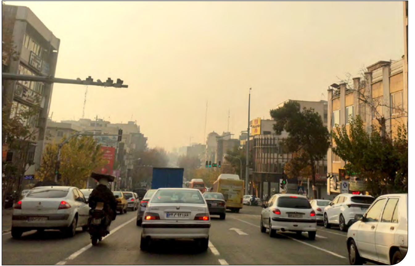
تولید آلودگی هوا در تهران

از ابتدای سال جاری تا ۱۶ آذر چهار روز هوای ناسالم و ۷۸ روز هوای ناسالم برای گروه‌های حساس در تهران ثبت شد