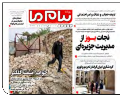
پیام ما دیروز