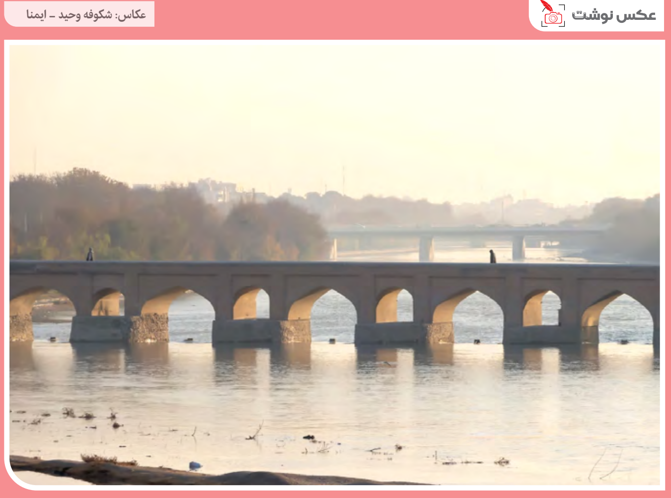
دیروز هفدهم آذرماه اطلاعات دریافتی از ۱۲ ایستگاه سنجش آلودگی هوای متعلق به شهرداری اصفهان و دو ایستگاه فعال اداره کل محیط‌زیست شاخص کیفیت هوا را در وضعیت هوای ناسالم نشان دادند.