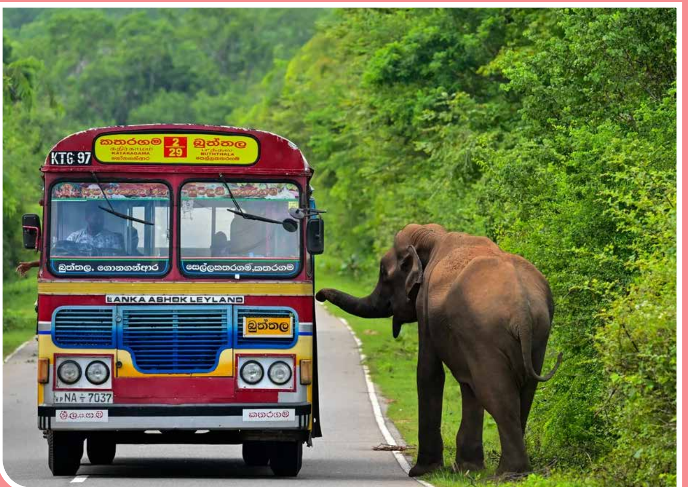
یک فیل در کاتاراگاما، سریلانکا، یک اتوبوس را بررسی می‌کند.