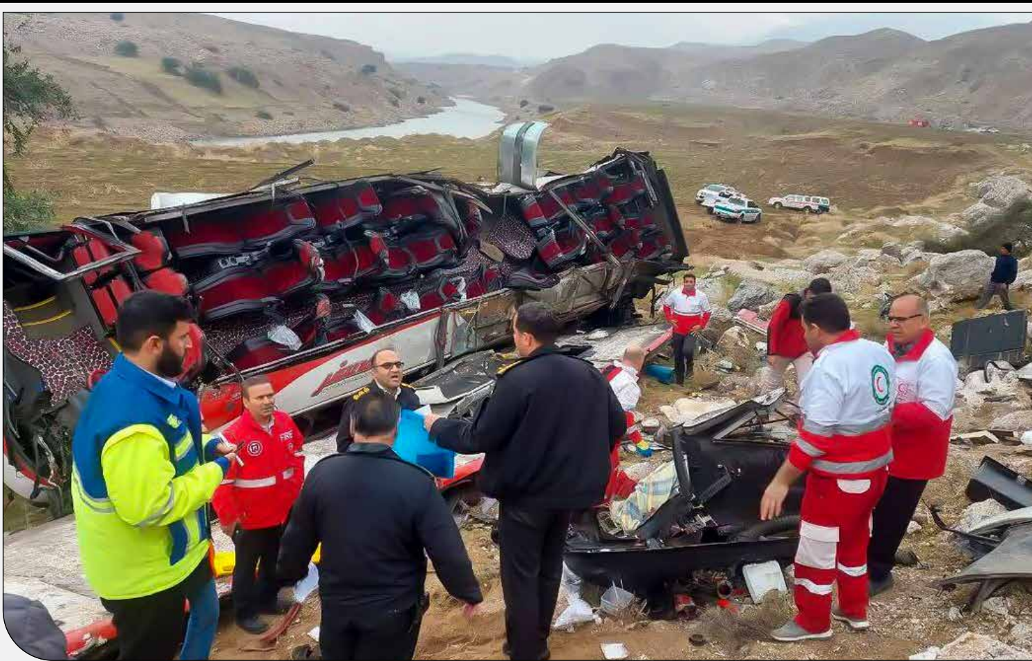
سقوط مرگبار اتوبوس در لرستان؛ ۱۰ کشته و ۱۷ مجروح برجای گذاشت