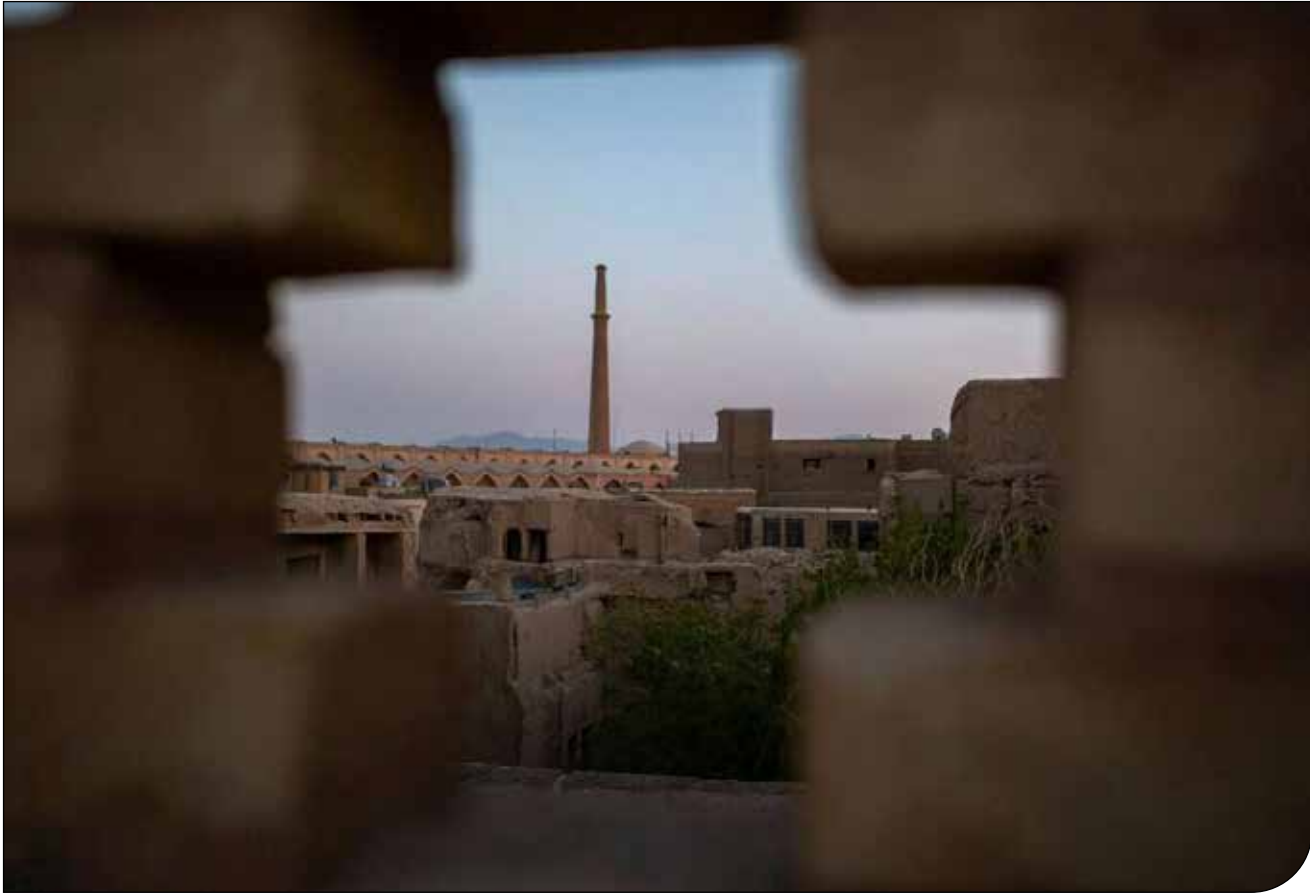
میراث آریا (۱۶۵)

بازنگری در محدوده بافت تاریخی اصفهان با هدف تسهیل نوسازی و رونق ساختوساز، نگرانی‌هایی را درباره تهدید هویت فرهنگی و جهانی این شهر تاریخی ایجاد کرده است