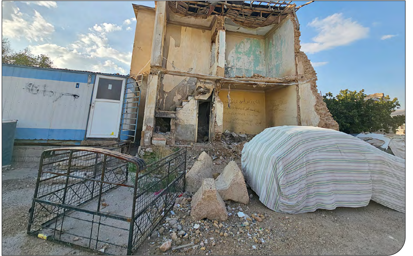
یک از آسیب‌دیده‌های بافت تاریخی شیراز که قربانی سوز و خروش‌ها شد

مدیرکل میراث‌فرهنگی استان فارس: مگر ممکن است بافت تاریخی را تخریب کنند؟ مگر از روی نقش من رد شوند