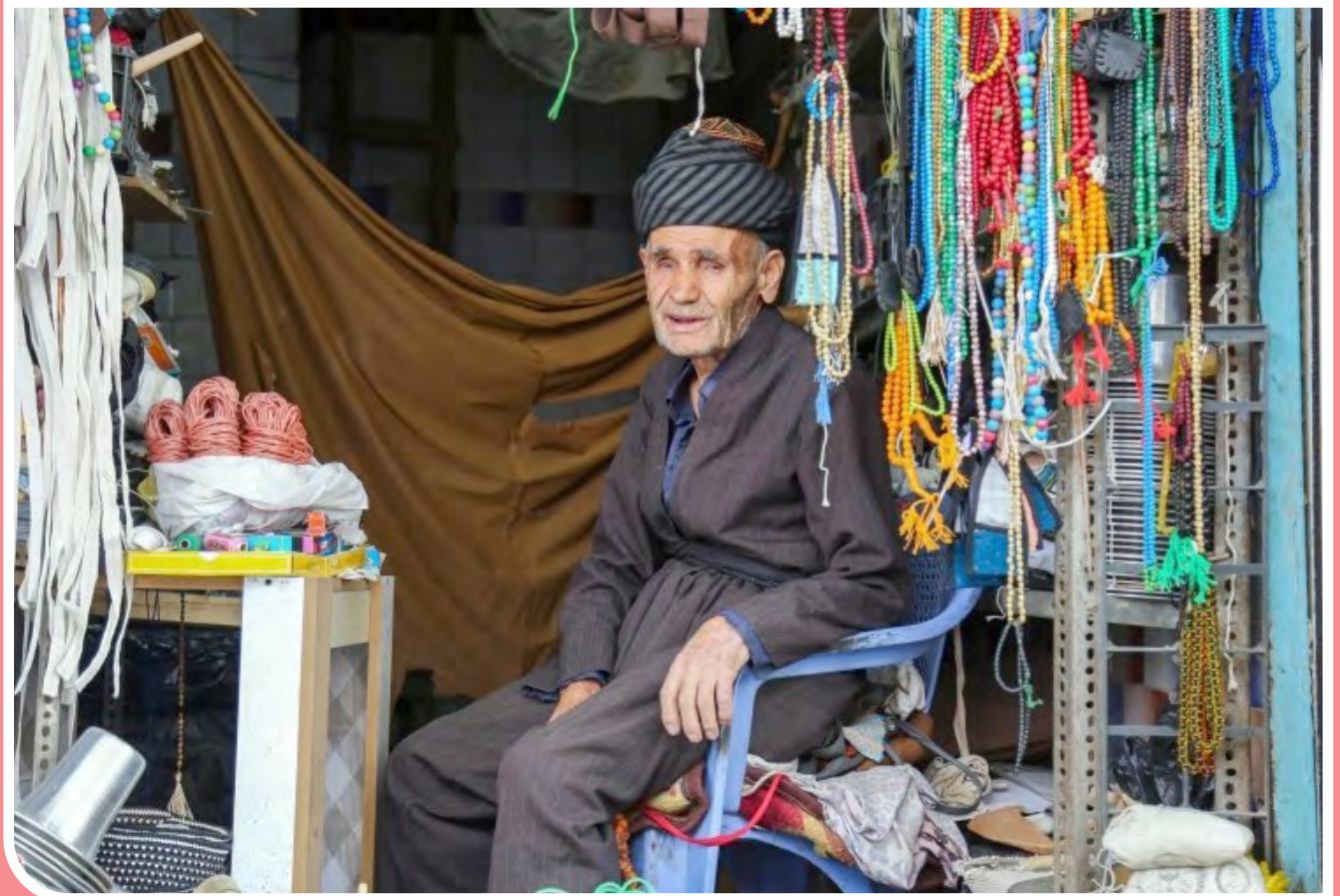
در شهرستان مریوان، برخی مشاغل هنوز به شکل سنتی خود توسط اهالی این شهر پیش می‌رود، به‌نحوی که در بعضی مناطق آن بازارچه‌های محلی وجود دارد که اجناس و محصولات مختلفی در آن به فروش می‌رسد. هرچند که رفته‌رفته و با گذر زمان، این شیوه کسب‌وکار در حال فراموشی است.