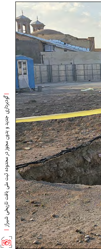
گودبرداری جدید و بدون مجوز در محوطه ثبت ملی بافت تاریخی شیراز

مشاهدات ما نشان می‌دهد یکی دیگر از خانه‌های سروپای ثبت ملی در بافت تاریخی به‌نام خانه «صدرچهری» در خطر جدی قرار گرفته است. به‌نظر می‌رسد برای