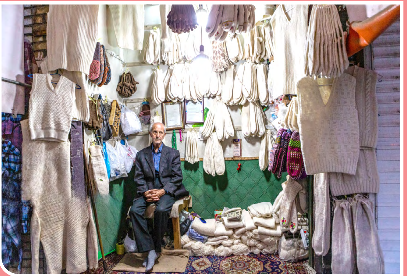
شهرستان «خوی» با قدمتی هفت‌هزار ساله، دومین شهر بزرگ و پرجمعیت استان آذربایجان غربی است که در شمال‌غربی‌ترین نقطه کشور، در نزدیکی مرز ایران و ترکیه قرار دارد. این شهر به لحاظ تمدن و جایگاه فرهنگی و با وجود آرامگاه شمس تبریزی، قطب فرهنگ و هنر ایران زمین نیز بشمار می‌آید.