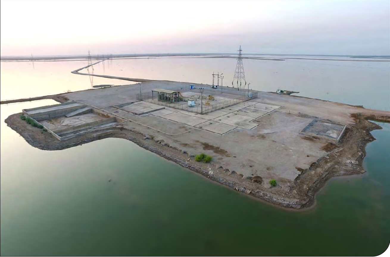
شرکت توسعه صنعت نفت گاز پارسیا (سپ)

«پیام‌ما» از آغاز حفاری‌های میدان نفتی یاران در هورالعظیم بدون مجوز سازمان حفاظت محیط‌زیست