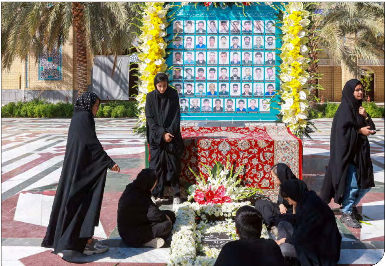
گزارش میدانی «پیام ما» از معدن «معدن‌جو» و گفت‌وگو با کارگران و خانواده‌های کشته‌شدگان معدن ۴۰ روز پس از حادثه