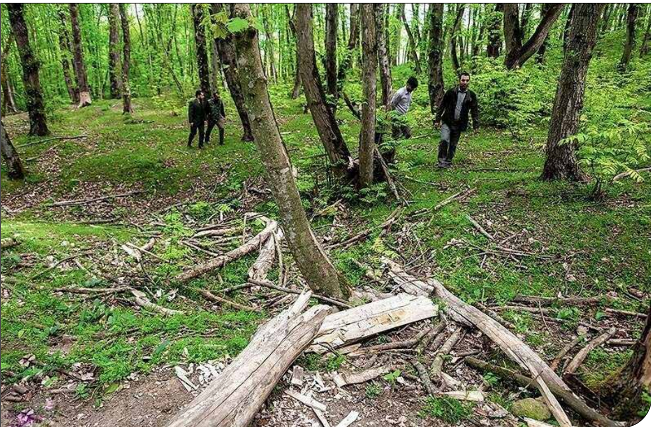
- [۵] - [۶]

شاهرخ جباری ارفعی؛ امروزه دانش جنگلداری و جنگل‌شناسی تأکید دارد که علاوه‌بر اینکه خشکه‌دار نباید از جنگل خارج شود بلکه بخشی از درختانی هم که تازه خشک شده یا شکسته-افتاده شده‌اند، باید بمانند تا تعادل جنگل محفوظ بماند