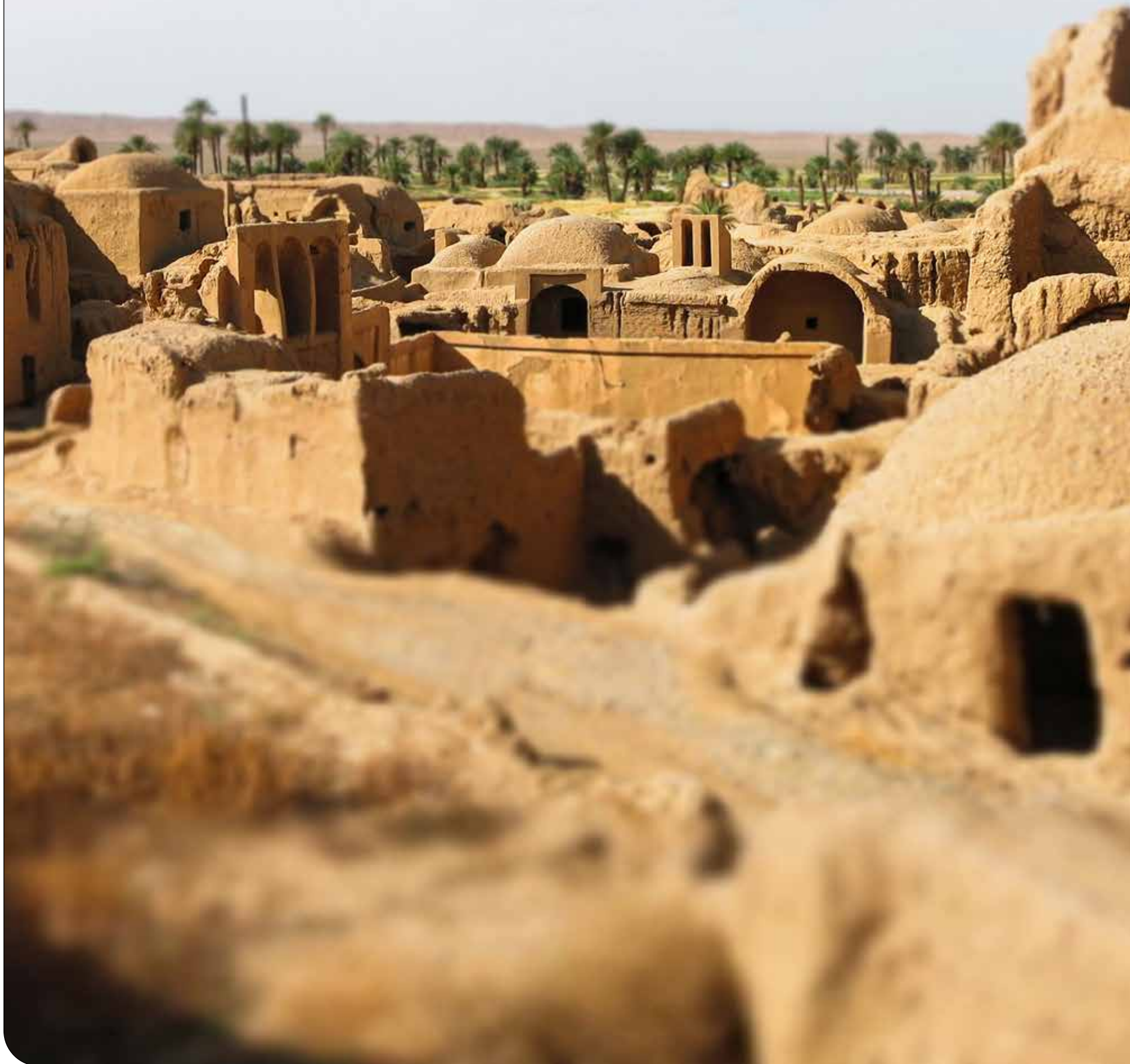
مهندسان مشاور عمارت خورشید

ایران در اجلاس بین‌المللی تغییراقلیم باکو باید چه اهدافی را اولویت قرار دهد؟