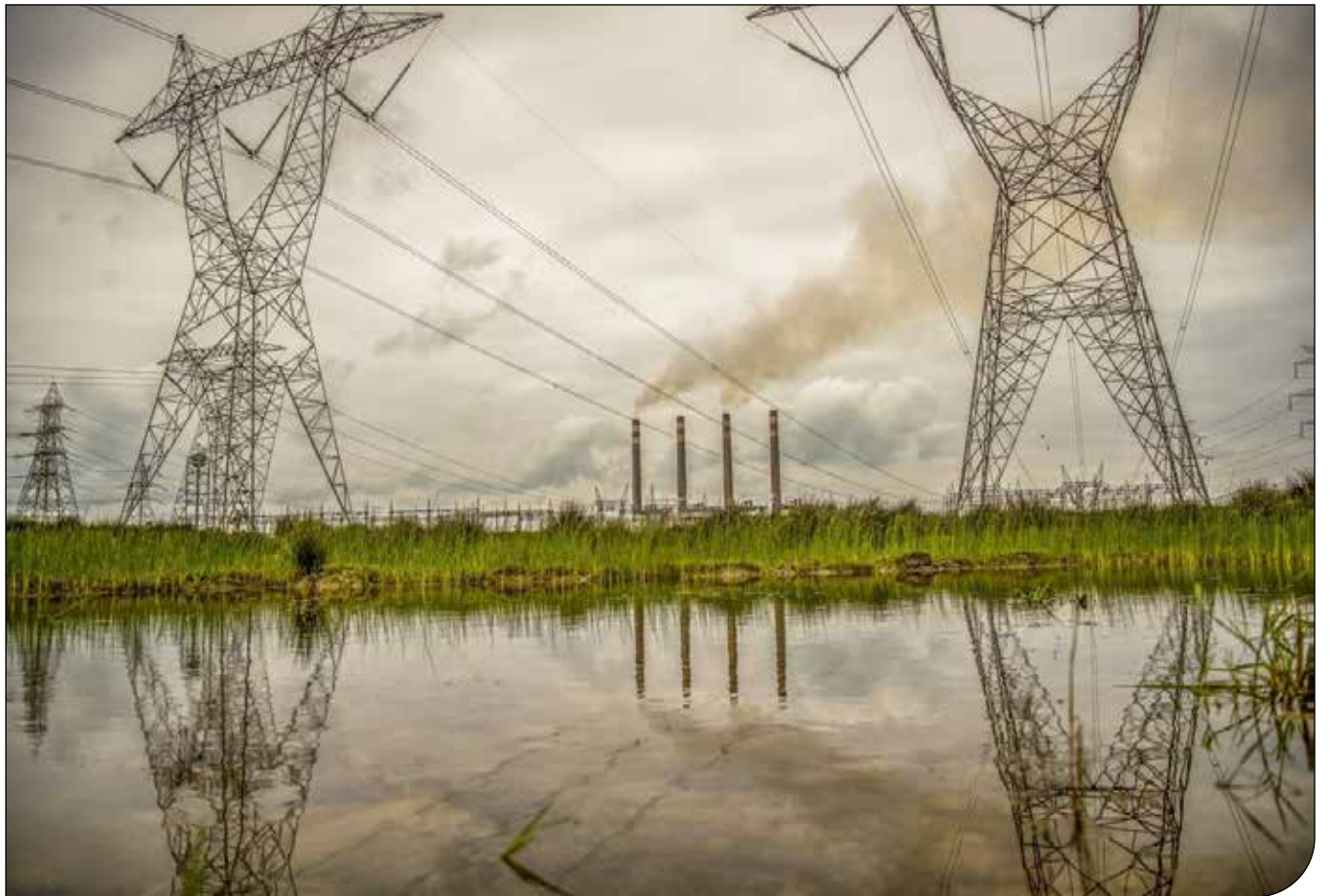
پاشنگه خیرنگاران چوان

علاوه بر کاهش استحصال گاز، میزان ذخایر سوخت مایع نیروگاه‌های از ۷۷ درصد سال گذشته به ۳۸ درصد کاهش پیدا کرده است