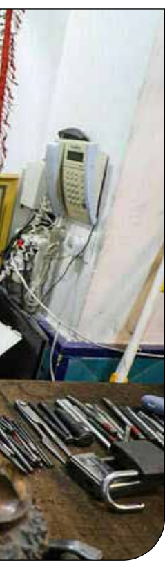
— [۶] —