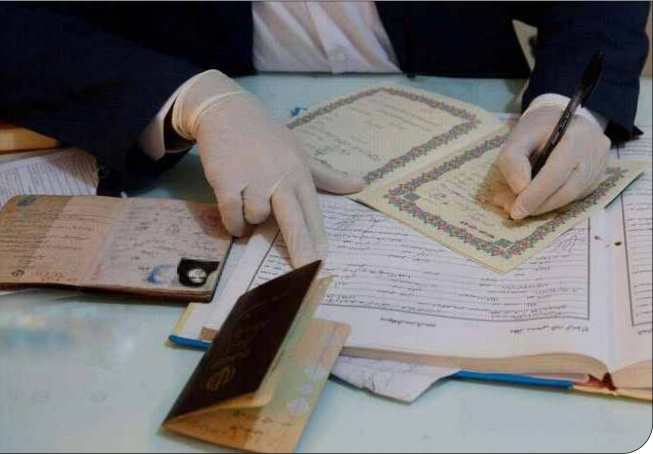
| اجرا |

کولبری فریادی از اعتراض مردمی است که به‌دنبال زندگی آبرومندانه هستند و توهین به شأن و شرافت مردمی است که تاریخشان سرشار از حماسه و افتخار است. مردم ما سزاوار آن نیستند که برای لقمه‌ای نان، زیر بار سنگین و نفس‌گیر زندگی جان ببازند. مرزهای ما سزاوار جاده‌های بی‌رحم برای جان‌فشانی نیستند بلکه شایسته بستر رشد و پیشرفت هستند. مردم ما لیاقت فرصت‌های واقعی و شغل‌های آبرومند و پایدار را دارند تا از چرخه بی‌پایان فقر و ناچاری رها یابند. کولبری نباید به میراثی تبدیل شود که از آن با افتخار یاد کنیم بلکه باید درسی باشد برای آیندگان تا هرگز تکرار نشود. دولتمردان باید برای آینده‌ای برنامه‌ریزی کنند که در آن، هیچ انسانی میان مرگ وزندگی، بار سنگین نان بر دوش نکشد. این زخم باید التیام یابد؛ باید به کولبری پایان داده شود تا در تاریخ ما حک نشود. باید دنیایی بسازیم که فرزندانمان شایسته زندگی شرافتمندانه باشند و برای شکوفایی سرزمینشان به پا خیزند. دولت چهاردهم این فرصت را دارد که امید را در جامعه بازآفرینی کند و برای فردایی بهتر تلاش کند. باید دست در دست هم داد تا این زخم تلخ تاریخ التیام بخشد و هویتی آبرومند برای مردم این سرزمین رقم‌زده شود.