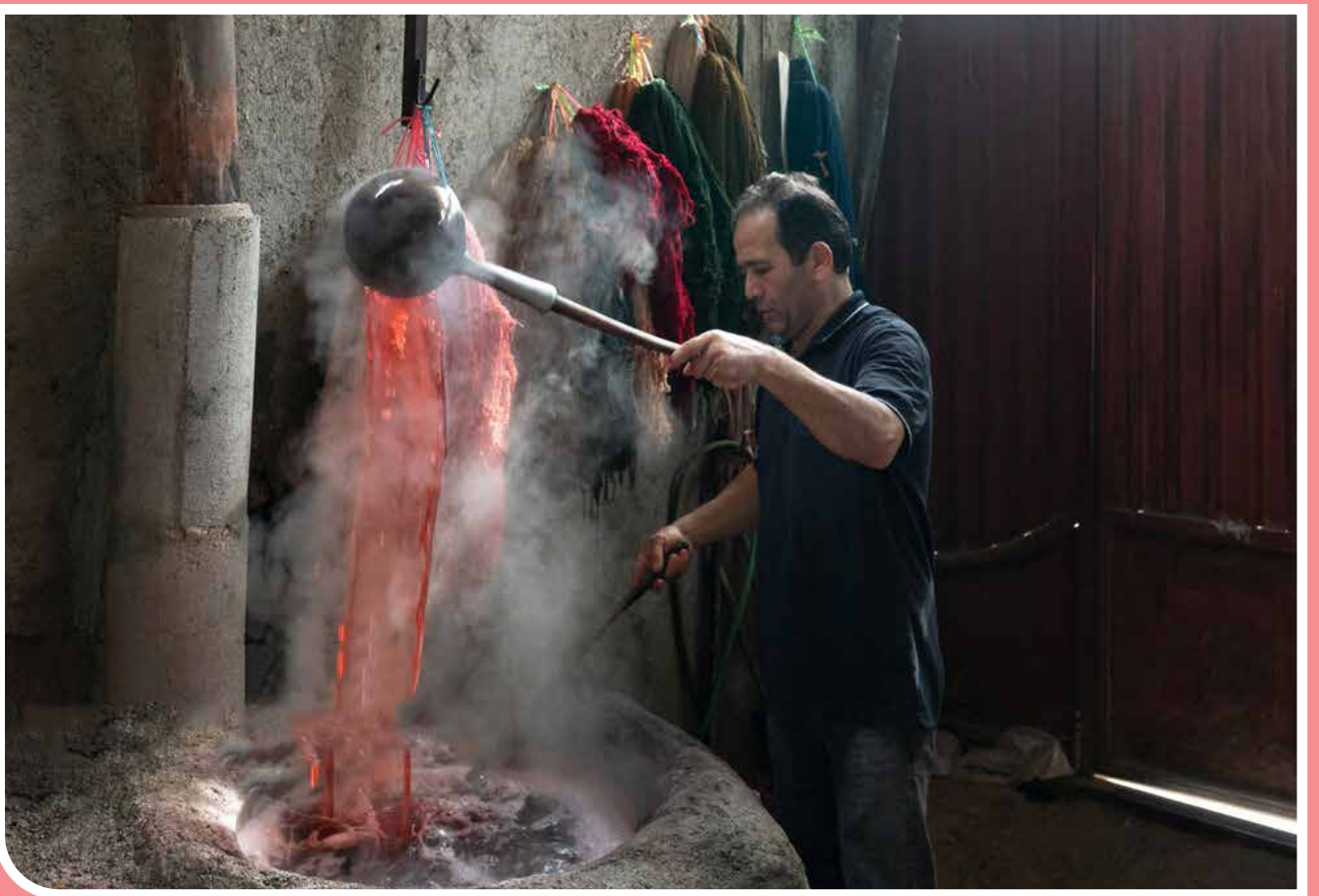
شهرستان خوی از جمله مهمترین قطب‌های تولید فرش در استان آذربایجان غربی است. فرش «ریز ماهی» خوی که قدمتی دیرینه دارد، در سال ۱۳۸۸ ثبت ملی شده و در سال ۱۳۹۲ نیز به ثبت جهانی رسیده است. علت نام‌گذاری فرش «ریز ماهی» خوی، وجود دو نقش ماهی در حاشیه این طرح است.