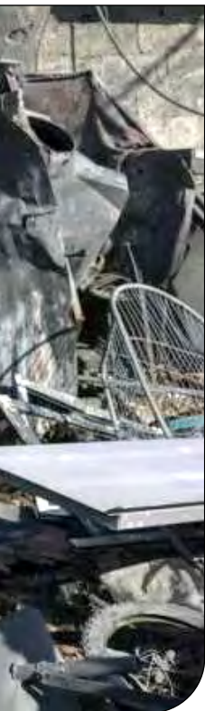
— عظیم —