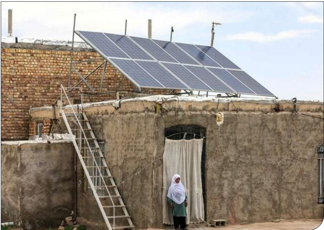
تولید پنل‌های خورشیدی کوچک مقیاس، راه‌حل ناترازی برق

بازارگاه تخصصی خریدوفروش برق کشور با عنوان «سامانه تخصیص برق ایران(ستبا)» به بهره‌برداری رسید. سامانه تخصیص برق ایران(ستبا) با هدف ایجاد بستری کارآمد، بمنظور تسهیل فرآیند مذاکرات خریدوفروش برق ایجاد شده است و امکان تبادل انرژی بین تأمین‌کنندگان و خریداران را فراهم می‌کند. این سامانه که در آدرس https://setba.ir قابل دسترسی است با دریافت مجوز خریدوفروشی برق از وزارت نیرو، این امکان را برای نیروگاه‌ها و سایر تأمین‌کنندگان برق از یک سو و خریدفروشان برق از سوی دیگر بوجود آورده است تا به دور از روند انجام مذاکرات طولانی بتوانند برق خود را با قیمتی مطلوب‌تر از انتظارشان معامله کنند. براساس گزارش ایسنا، تفاوت اصلی این بازارگاه، برگزاکردن حراج یک طرفه قیمت دوم است. به این معنی که دربخش فروشندگان برق، پایین‌ترین قیمت برنده این حراج خواهد بود، درحالی‌که مبلغ معامله با قیمت ثبت‌شده نفر قبلی خواهد بود. در این حالت اگرچه برنده این حراج تولیدکننده‌ای است که بهترین قیمت را اعلام کرده است، اما این معامله فروش با قیمتی بالاتر از قیمت ثبت‌شده اتفاق خواهد افتاد. این مکانیزم اجرای معاملات شرایطی را ایجاد می‌کند که چه خریدار و چه فروشنده قیمت واقعی انتظاری خود را ثبت کنند، تا به دور از چانه زنی‌های فرسایشی، معاملات برق محقق شود.