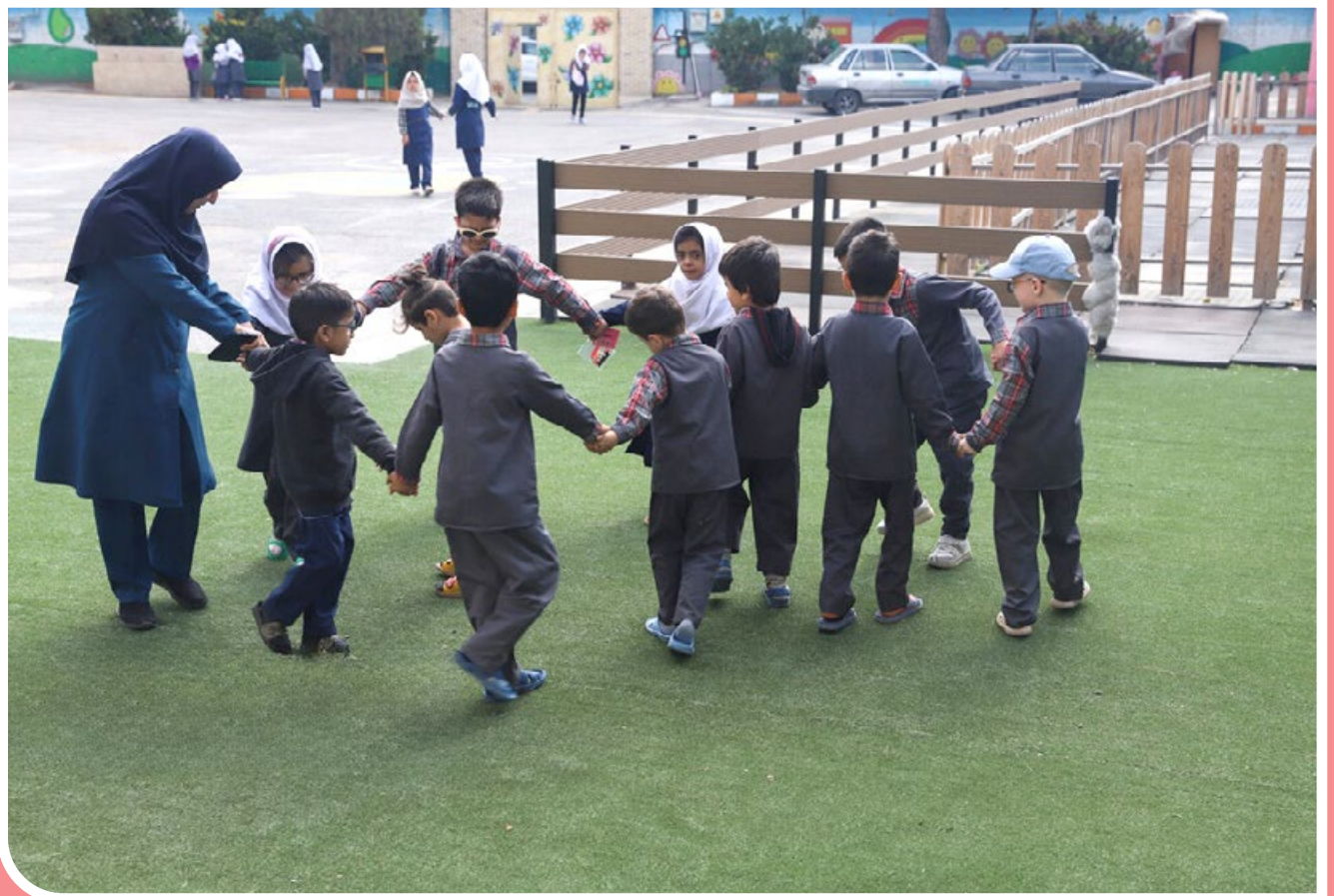
مدرسه طراوت سزاوار رحمت اولین پیش‌دبستانی تخصصی کودکان نابینا است که در سال ۱۴۰۰ ساخته و تجهیز شده است. نیروهای حرفه‌ای این مدرسه در تلاش هستند تا مهارت‌های خوداتکایی را به کودکان نابینا و کم‌بینا آموزش دهند.