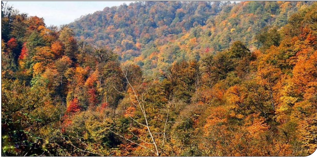
ایران | آذربایجان