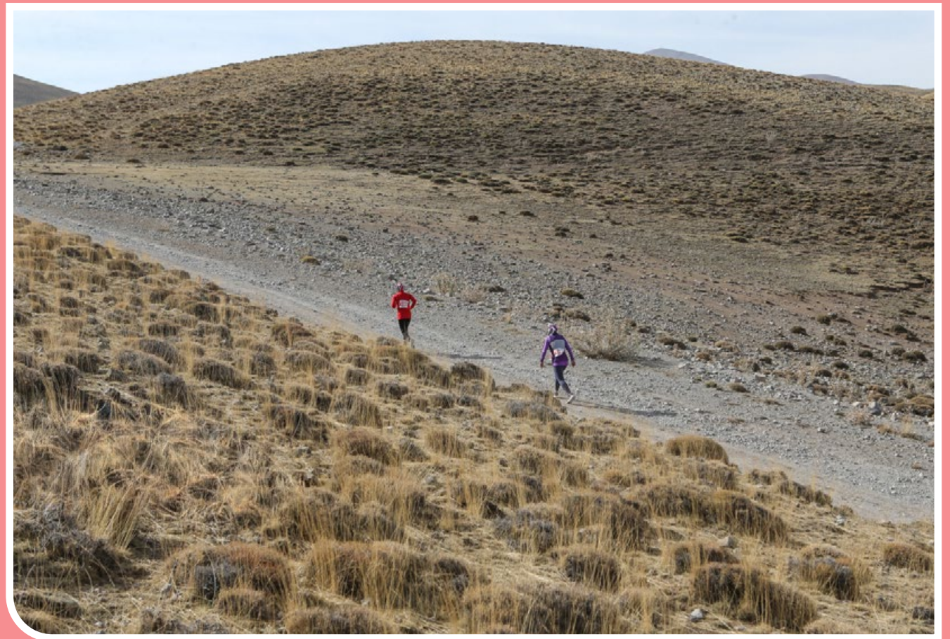
دهمین دوره مسابقات دوی کوهستان قهرمانی کشوری رشته‌های اسکای و ورتیکال در چهار رده سنی زنان و مردان با شرکت ۱۲۴ شرکت‌کننده از سراسر کشور روز جمعه، ۲۰ مهرماه، به میزبانی هیئت کوهنوردی آذربایجان شرقی در قله کمال و رشته‌کوه‌های سه‌پند تبری برگزار شد.