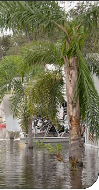
— ۱۵ —

روز جهانی کاهش خطر بلایا همچنین فرصتی برای تأکید بر اهمیت همکاری جهانی است. بلایا مرز نمی‌شناسند و تأثیرات آنها می‌تواند فراتر از جغرافیای یک کشور یا منطقه گسترش یابد؛ بنابراین کشورهای جهان باید با ایجاد شبکه‌های همکاری بین‌المللی، انتقال تجربیات و فناوری‌ها و همچنین اجرای برنامه‌های مشترک به مقابله با خطرات جهانی بپردازند. در این راستا نسل جوان با بهره‌مندی از فناوری‌های نوین و رویکردهای خلاقانه نقش مهمی در تسریع این همکاری‌ها و توسعه راه‌حل‌های جدید ایفا خواهد کرد. شعار اسسال روز جهانی کاهش خطر بلایا با تأکید بر توانمندسازی نسل آینده نشان می‌دهد که آینده‌ای تاب‌آور و امن تنها با آموزش، آگاهی و تقویت جوانان قابل‌دستیابی است. این روز یادآور مسؤلیت مشترک جامعه جهانی برای حمایت از نسل‌های آینده در مواجهه با بلایای پیچیده و فرایزنده است. با سرمایه‌گذاری در آموزش و تربیت می‌توانیم جهانی تاب‌آورتر و پایدارتر برای همگان فراهم کنیم، جهانی که در آن انسان‌ها نه‌تنها در برابر بلایا مقاوم هستند؛ بلکه از این چالش‌ها به‌عنوان فرصت‌هایی برای رشد و پیشرفت استفاده می‌کنند