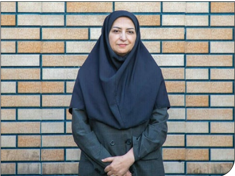
پیش از هر امر و تصمیم‌گیری دیگری در کشور توسط معاون اول رئیس‌جمهور بسیار مهم است و اگر فقط بر همین اصل پایبند باشیم، قادر خواهیم بود وضعیت نامطلوب دریاچه ارومیه در ابتدای شروع به کار دولت چهاردهم را با شرایط مناسب‌تری پیش ببریم.

اتفاق نظر اعضا در این موضوع نهایتاً منجر به این شد که دکتر عارف دستور داد با همکاری معاونان و استانداران سه استان حوضه آبریز دریاچه ارومیه و مسئولان سایر دستگاه‌ها بررسی‌های لازم درباره اقدامات گذشته و راهکارهای علمی برای نجات دریاچه ارومیه صورت گرفته و ظرف مدت یک‌ماه،