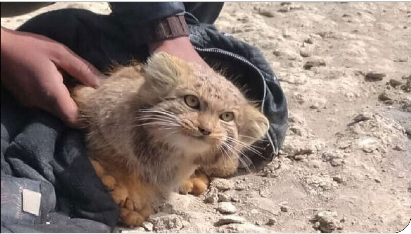
تولده گربه پالاس

دامپزشک متخصص در اداره محیط‌زیست شیروان وجود نداشت و مشورت با دامپزشکان دیگر هم برای علت مرگ به جواب قانع‌کننده‌ای نرسید