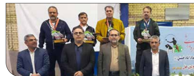
سازمان امام حسین

مبشری گفت: در این جشنواره ۳۱ تیم در رشته ورزشی کورن هول و ۳۲ تیم در رشته فوتبال‌دستی به مدت دو روز به رقابت پرداختند. او تصریح کرد: در پایان این رقابت‌ها در رشته