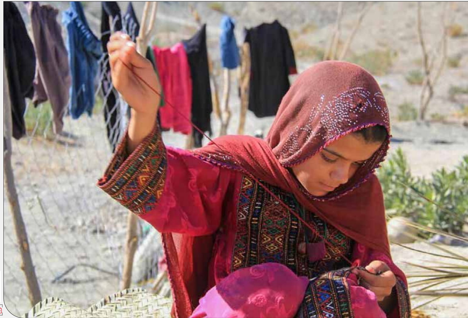
پایگاه خبری بازار

هر وقت در منطقه‌ای رشد گردشگری شکل بگیرد، حساسیت مردم بومی به حفاظت از محیط‌زیست و بناهای تاریخی بیشتر می‌شود