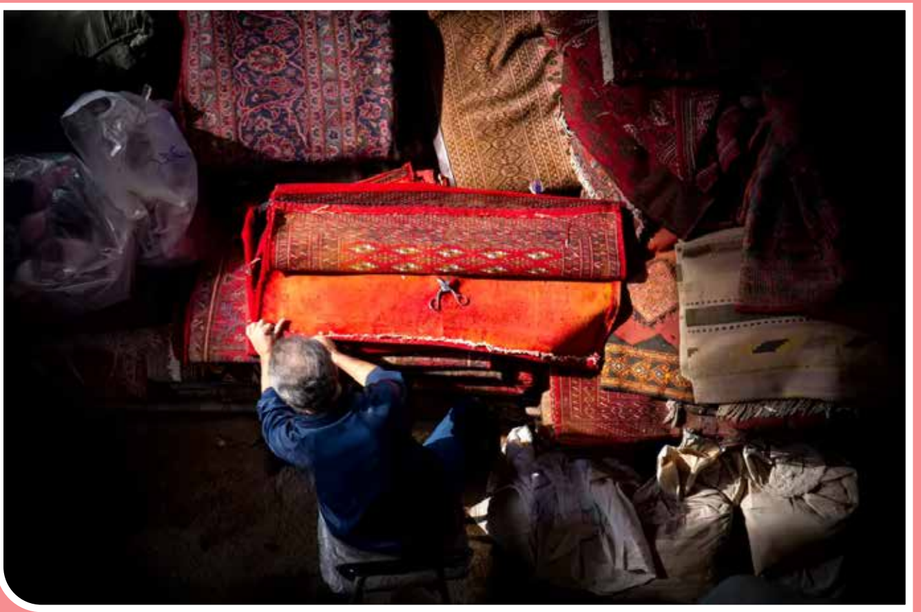
بازار بزرگ در بین سال‌های ۹۰۷ تا ۱۳۳۵ و در دوره حکومت صفویان به وجود آمده است. براساس متون به جای مانده تاریخی، اولین بنایی که در بازار تهران ساخته شد، در دوره شاه طهماسب اول صفوی بود. بازار تهران محله‌ای است قدیمی واقع در مرکز شهر بزرگ تهران در منطقه ۱۲ تهران است. یکی از مهمترین بخش‌های اقتصاد ایران، بازار فرش در تهران است که آن را به عنوان قلب تپنده فرش‌های دستباف می‌شناسند.