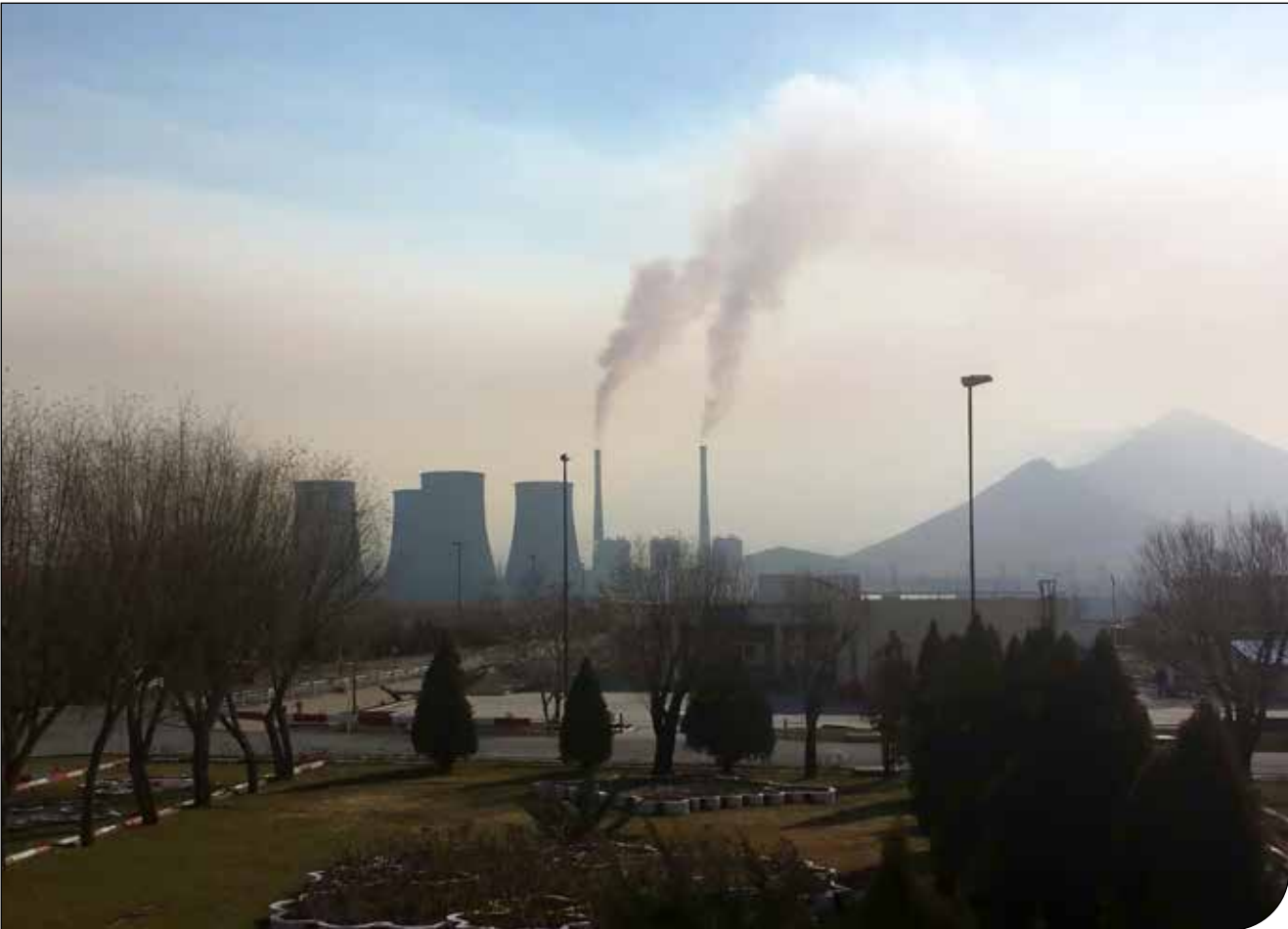
خبرگزاری دانشجو - اراک