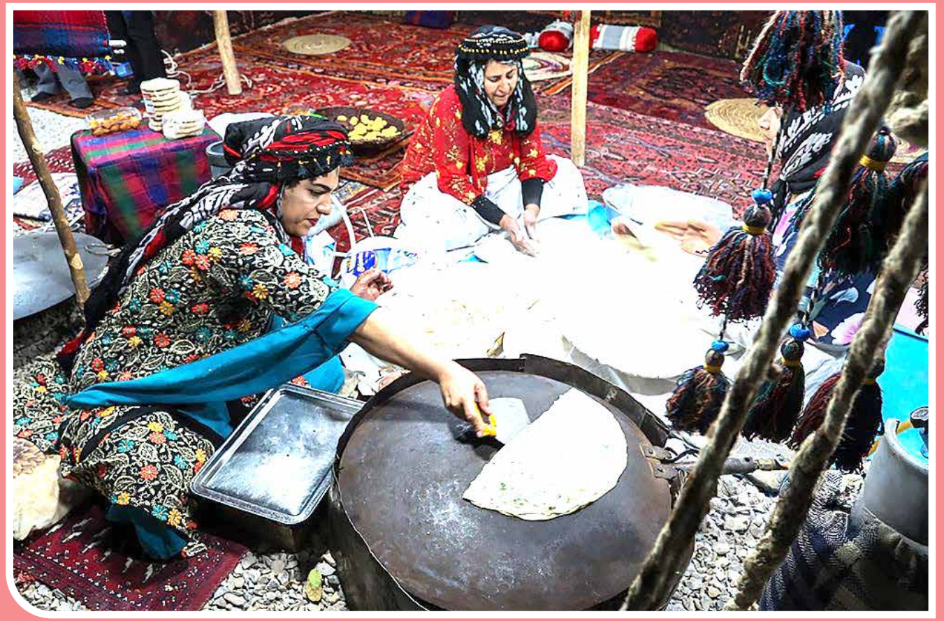
دومین جشنواره ملی نان از ۲۴ الی ۲۷ مهر ماه ۱۴۰۳ در کرمان و با حضور ۲۷ استان، از سراسر کشور و ۱۵ شهرستان برگزار شد. این جشنواره، با هدف معرفی نان‌های مختلف کشور و سرزمینی ایران، برگزار شده بود. استان کرمان در حوزه میراث فرهنگی ناملموس ۱۴۰ مورد از آنها گونه‌های مختلف خوراک و تغذیه و شش مورد مربوط به بخش نان و روش‌های مختلف پخت نان است.