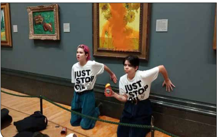
گالری ملی پس از حمله معترضان به نقاشی‌هایی از جمله «آفتابگردان‌ها» اثر «وینسنت ون گوگ»، «گاری علوفه» اثر «جان کانستبل» و «آینه ونوس» اثر «دیوگو والاسکز» تدابیر امنیتی را افزایش داده است.

خواهند شد و از بازدیدکنندگان خواسته شده است که تا حد ممکن کمترین اقدام را به‌همراه داشته باشند و کیسه‌های بزرگ نداشته باشند. همچنین استفاده از «وسایل پوشیدنی یا نمایی که توهین‌آمیز یا وابسته به سازمان‌هایی هستند که مجموعه را تهدید فیزیکی می‌کنند» و همچنین توزیع هرگونه مواد مربوط به کمپین‌ها در گالری ممنوع خواهد بود. در بیانیه گالری ملی آمده است: «بدنبال حوادث اخیر در گالری، اکنون لازم است تدابیر امنیتی برای اطمینان از ایمنی همه بازدیدکنندگان، کارکنان گالری ملی و مجموعه نقاشی‌های کشور افزایش پیدا کند.» گالری ملی از جولای ۲۰۲۲ با پنج حمله جداگانه به برخی از ارزشمندترین نقاشی‌های خود مواجه شده است که دو مورد از آنها در دو هفته گذشته اتفاق افتاده است. اخیراً پس از اینکه چند عضو از یک گروه از معترضان به‌دلیل آسیب رساندن به قاب طلایی یکی از نقاشی‌های «گل آفتابگردان» اثر «ون گوگ» زندانی شدند، گروهی دیگر از معترضان گروه «استفاده از نفت را متوقف کنید» روی دو نقاشی ون‌گوگ سوپ ریختند. باین‌حال، گالری ملی لندن تنها مؤسسه هنری نیست که با چنین بحرانی مواجه شده است.