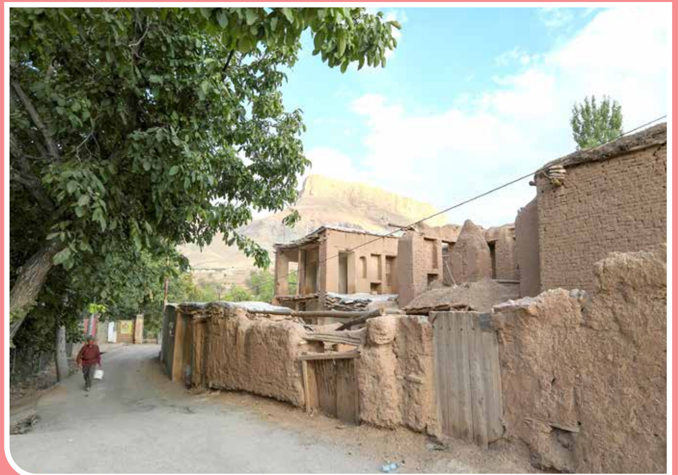
روستای «وشتگان» در شهرستان دیلیجان و بخش مرکزی و دهستان جاسب استان مرکزی واقع شده و آب‌وهوای بسیار مطلوبی دارد.