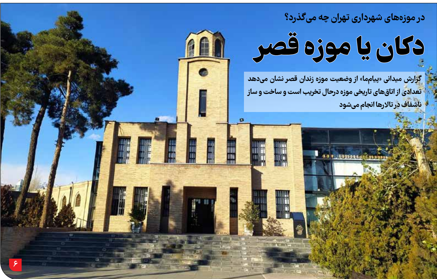
در موزه‌های شهرداری تهران چه می‌گذرد؟

نتیجه نظرسنجی «پیام ما»: سازمان منابع طبیعی و آبخیزداری به‌جای عمل «بهره‌برداری و توسعه عرصه‌های طبیعی کشور»، به رسالت «حفظ و احیا» این عرصه‌ها اهتمام ورزد