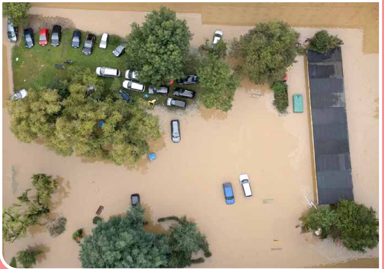
با طغیان رودخانه‌ها، سیل بخش‌هایی از اروپای مرکزی را فرا گرفت. تاکنون ۲۱ نفر در اثر این سیلاب کشته شده‌اند.