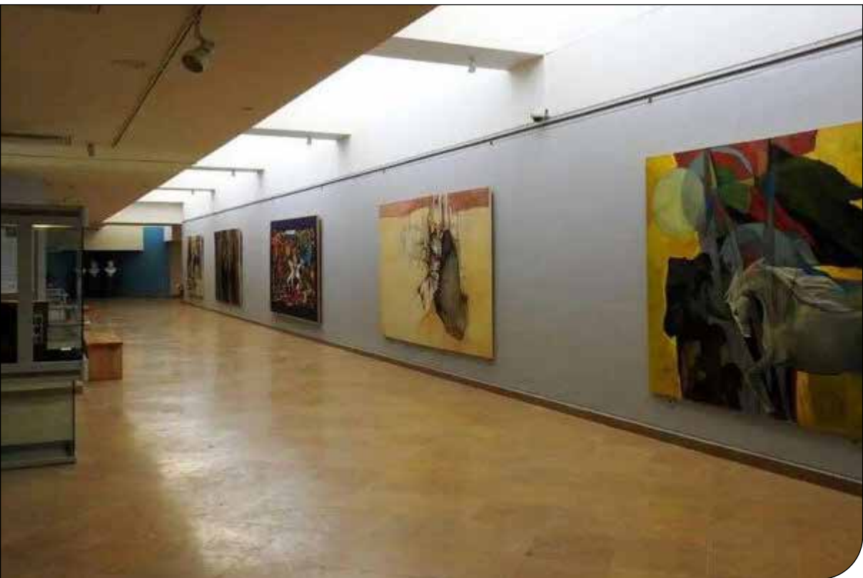
— ۱ —

به نقل از «رویترز»، «متاپلتفرمز» در حال افزودن قابلیت‌های حفاظت از حریم خصوصی و کنترل والدین به حساب‌های اینستاگرام کاربران زیر ۱۸ سال است؛ این اقدامی مهم برای برطرف‌کردن نگرانی‌های فزاینده دربارهٔ تأثیرات منفی شبکه‌های اجتماعی بر نوجوانان و