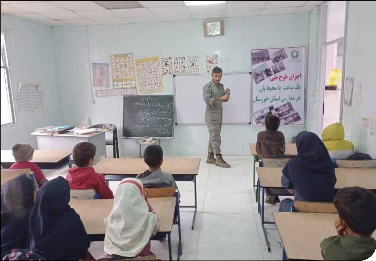
محیط‌زیست آموزشگاه در استان خوزستان