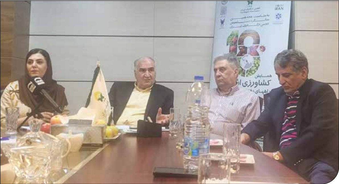
«ایکس» تا پایان

«استارلینک» یکی از موضوعات داغ این روزهاست؛ تعدادی از تجربهٔ استفاده از استارلینک می‌نویسند، تعدادی دیگران را تشویق به خرید و استفاده از آن می‌کنند و کاربرانی نکاتی را در مورد آن ارائه می‌کنند. نکاتی که یادآوری می‌شوند، شامل گرانی و عدم دسترسی به سایت‌های داخلی است. اگرچه که استارلینک تجربهٔ دسترسی به اینترنت آزاد را فراهم می‌کند، اما هزینهٔ خرید و اشتراک ملاحظهٔ آن، برای بسیاری مقدرور نیست. همچنین سایت‌های بانکی و بخشی از سایت‌های داخلی، تنها از طریق اینترنت‌های داخل کشور قابلیت دسترسی دارند که این امر استفاده از استارلینک را پیچیده می‌کند. بخش جدانشدنی توییتر (ایکس) فارسی است. بازی با مفاهیم و کلمات، روندی است که سال‌هاست در این شبکه جریان دارد. این‌بار نوبت کاربری بود که همسر خود را با عنوان رئیس خطاب کرد و «رئیس»، به پراسفادترین کلمهٔ توییتر برای تولید محتوای طنز تبدیل شد.