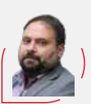
سید مهدی سجاذاده | منتقد سینما