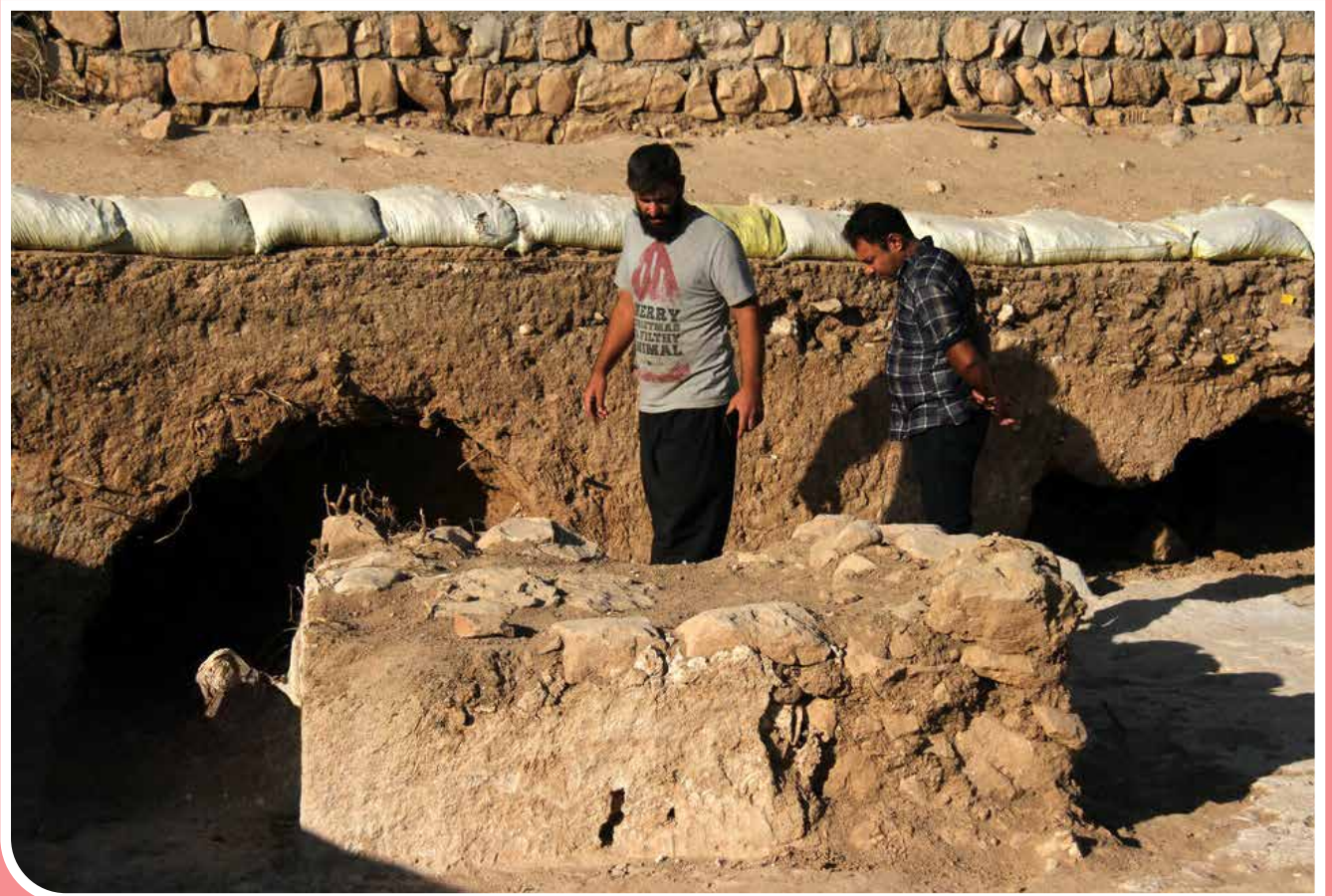
بقایای آتشکده دوران ساسانی، در کوه‌دشت لرستان کشف شده است. در این کاوش، چهارطاقی اصلی معمر آتشدان، عناصر و زوایای معماری نظیر گچ‌بری‌های تزئینی کشف شده است. به گفته باستان‌شناسان، این بنا که تاکنون ۱۰ درصد از کاوش آن به انجام رسیده، حلقه‌گم‌شده و تکمیل‌کننده فرهنگ و تاریخ غرب کشور است.