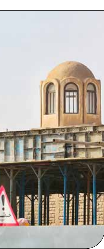
باشگاه خبرنگاران جوان | ۱۵