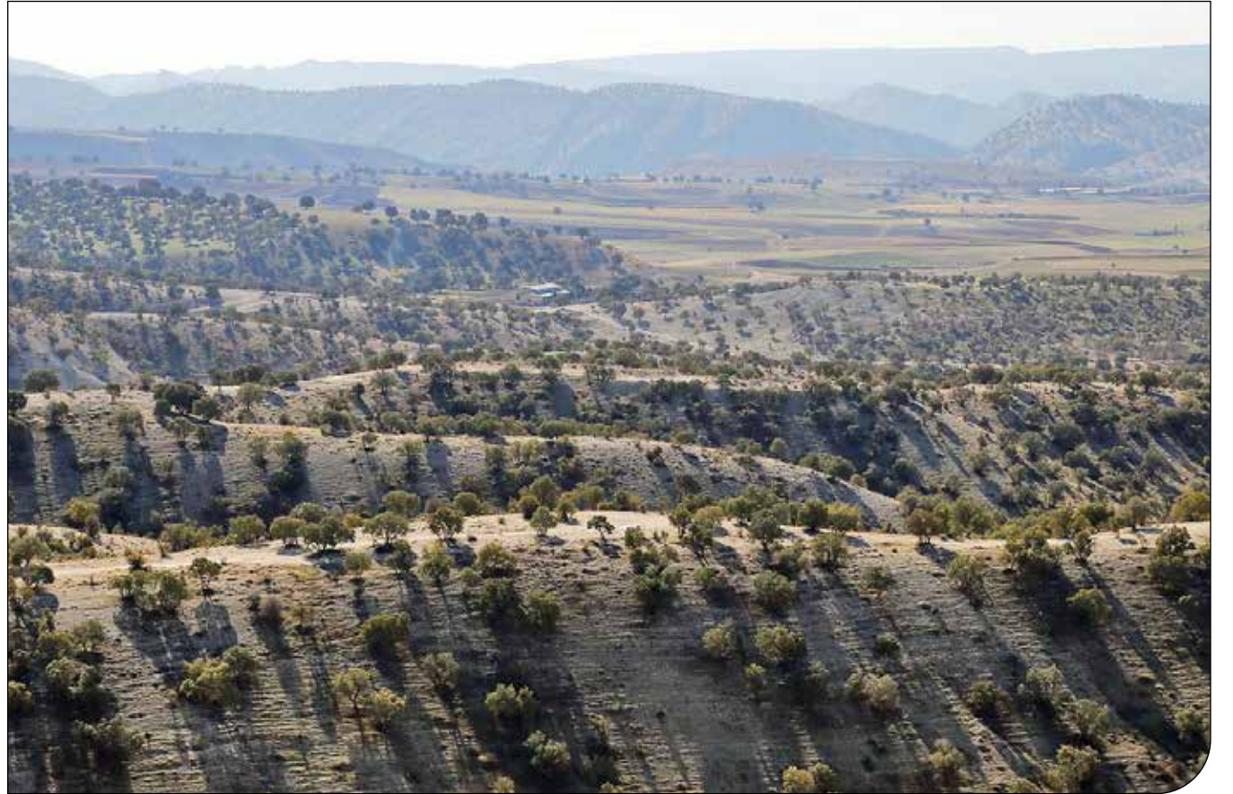
مدیریت زاگرس از نکات عجیب و مهم در سازمان منابع طبیعی است. در استراتژیک‌ترین عرصه طبیعی کشور، هرازگاهی طرح و برنامه - ای سر بر می‌آورد و بعد از هیاهویی بسیار، در سکوت کنار گذاشته می‌شود.

با غلبه تفکر زراعی بر ساختار تشکیلات منابع طبیعی و بنگاه زمین انگاشتن طبیعت، با نماینده ویژه یا بدون آن، گره‌ای از مشکلات زاگرس باز نمی‌شود