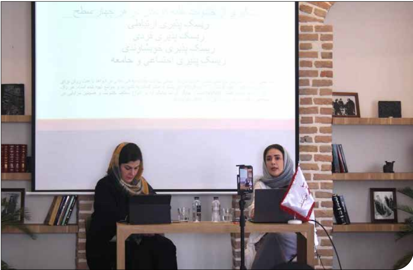
نشست «خشونت علیه کودکان، علل و راهکارها از منظر حقوقی و روانشناسی» برگزار شد. در این نشست، کارشناسان تلاش کردند با بررسی مصادیق خشونت علیه کودکان و علل آن، به معرفی اقدامات و راهکارهای پیشگیرانهٔ حقوقی و روانشناختی بپردازند.

خشونت در همهٔ آسب‌های روانشناختی و اجتماعی ناشی از خشونت، همهٔ افراد یک جامعه را درگیر کرده و منجر به ساخته‌شدن یک چرخه می‌شود. مطالعات روانشناختی و جامعه‌شناختی نشان می‌دهند که برای شکستن چرخهٔ خشونت، فقط یک راه وجود دارد و آن افزایش آگاهی و در پی آن تلاش برای پیشگیری است. نظارت دستگاه قضایی با ایجاد قوانین کاربردی در این حوزه نیز می‌تواند در