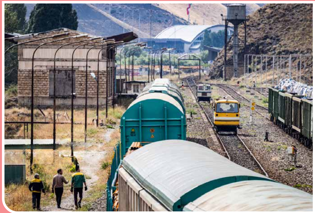
ایستگاه راه‌آهن تبریز، یکی از بزرگ‌ترین ایستگاه‌های ایران و شمال غرب کشور و از نمونه‌های ارزشمند معماری ایستگاهی به شمار می‌آید. تکمیل بنای این ایستگاه در سال ۱۳۳۹ شمسی، دو سال پس از گشایش و راه‌اندازی راه‌آهن تهران - تبریز، در مکان قبلی که در سال ۱۲۹۴ شمسی ساخته شده بود، آغاز شد.