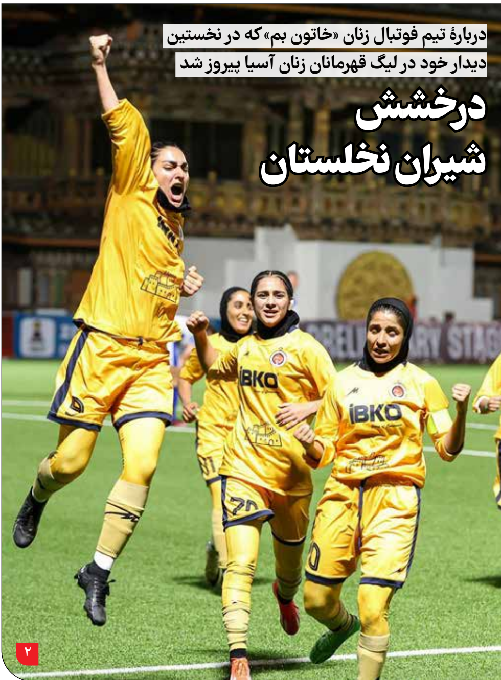
درباره تیم فوتبال زنان «خاتون بم» که در نخستین دیدار خود در لیگ قهرمانان زنان آسیا پیروز شد

حالا که «صالحی امیری» به‌عنوان سومین وزیر میراث فرهنگی، گردشگری و صنایع‌دستی، کلید دفتر جدیدش را از «عزت‌الله ضرغامی» وزیر پیشین، گرفته و رسماً آغاز به کار کرده، همه مرتب‌ترین منتظر اولین تصمیمات او در عزل‌ونصب‌ها و سیاست‌گذاری‌های راهبردی وزارتخانه هستند. به اعتقاد کارشناسان، باتوجه تجربه کم و تخصص غیرمرتبط صالحی امیری در حوزه‌های سه‌گانه وزارتخانه، نقش معاونان او برای تشخیص راه از چاه‌های عمیقی که طی سال‌های متمادی ایجاد شده و یا باقی مانده، بسیار حائز اهمیت خواهد بود. البته لازم به ذکر است که صالحی امیری هم در اولین سخنان خود در ارگ آزادی، به این مورد اشاره کرده و از تصمیم‌سازی کارشناسان و تصمیم‌گیری خود گفته است. اما وزیر جدید گردشگری چه اولویت‌هایی در تصمیم‌گیری دارد؟ در این رابطه در «پیام ما» با فعالان دو حوزه گردشگری و صنایع‌دستی گفت‌وگو کردیم تا راحل‌های موردنظر آن‌ها را برای برون‌رفت از وضعیت رکودی صنعت گردشگری و صنایع‌دستی کشور جویا شویم و امیدوار باشیم که برسد به دست آقای وزیر!