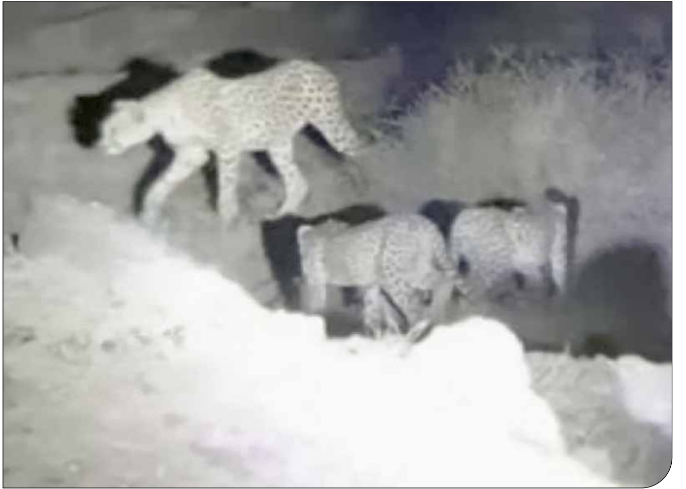
سازمان محیط زیست

در پایش‌های جدید جمعیت‌مان شکننده‌تر است و نتوانسته‌ایم برخی از یوزها و بسیاری از توله‌های مستقل شده قبلی را دوباره ببینیم