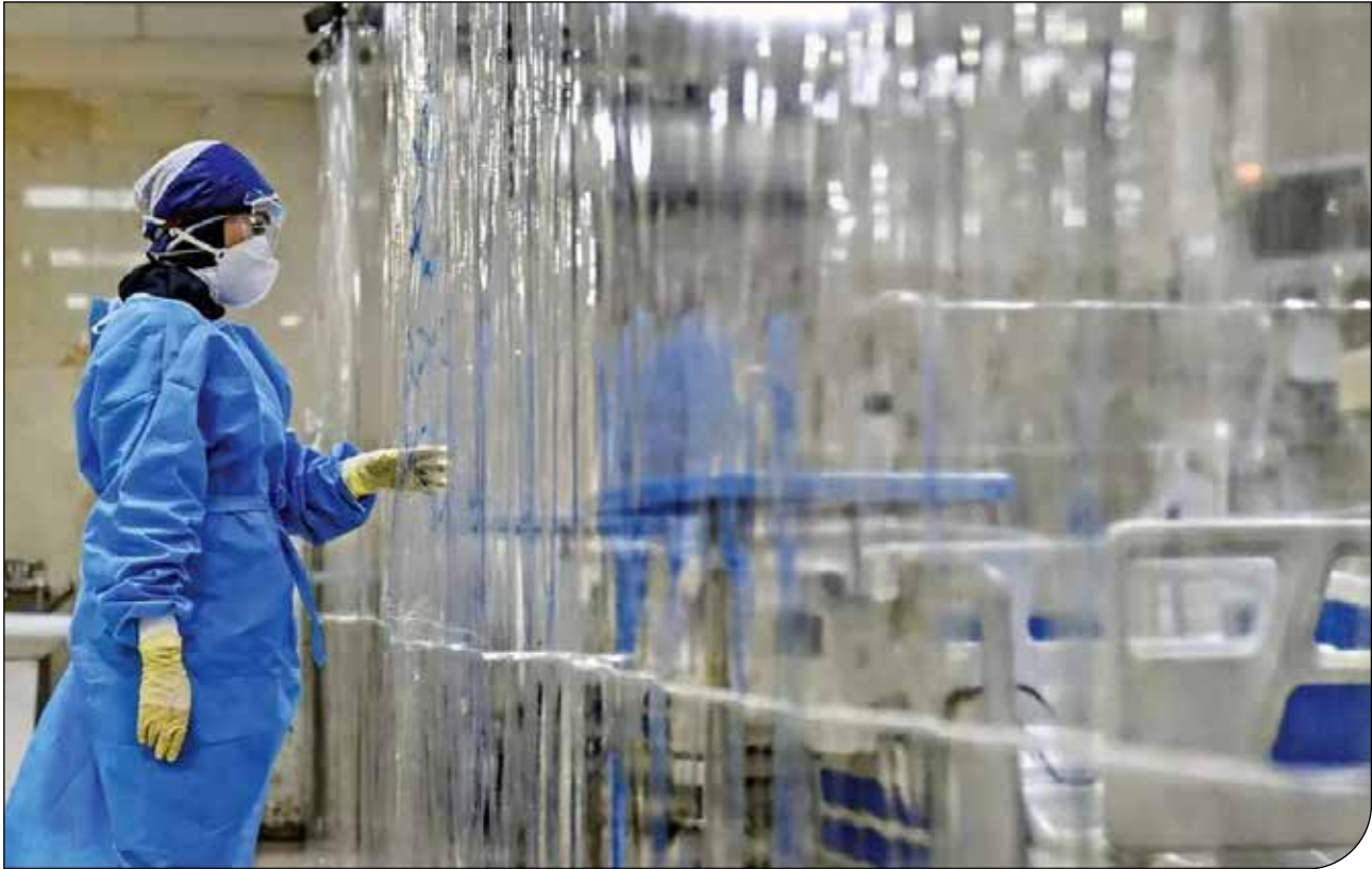
بیمارستان‌های جدید به دلیل نبود پرستار فعال نشده‌اند