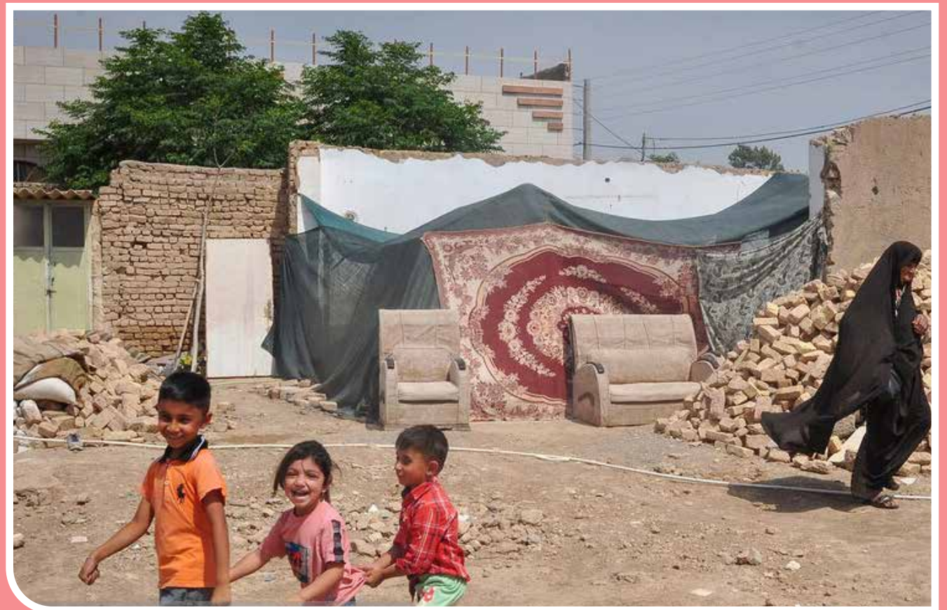
با وجود اینکه حدود ۲ ماه از زمین‌لرزه ۵ ریشتری کاشمر می‌گذرد و به‌دنبال آن، منازل مسکونی بسیاری در روستاهای زنده‌جان، کسریه و محمدیه آسیب کامل دیدند، همچنان خانواده‌هایی هستند که این روزهای گرم طاقت‌فرسا را در چادر زندگی می‌کنند. این درحالی‌ست که روند پیشرفت ساخت‌وساز واحدهای آسیب‌دیده و تخریب‌شده در این روستاها، وضعیت قابل‌قبولی ندارد.