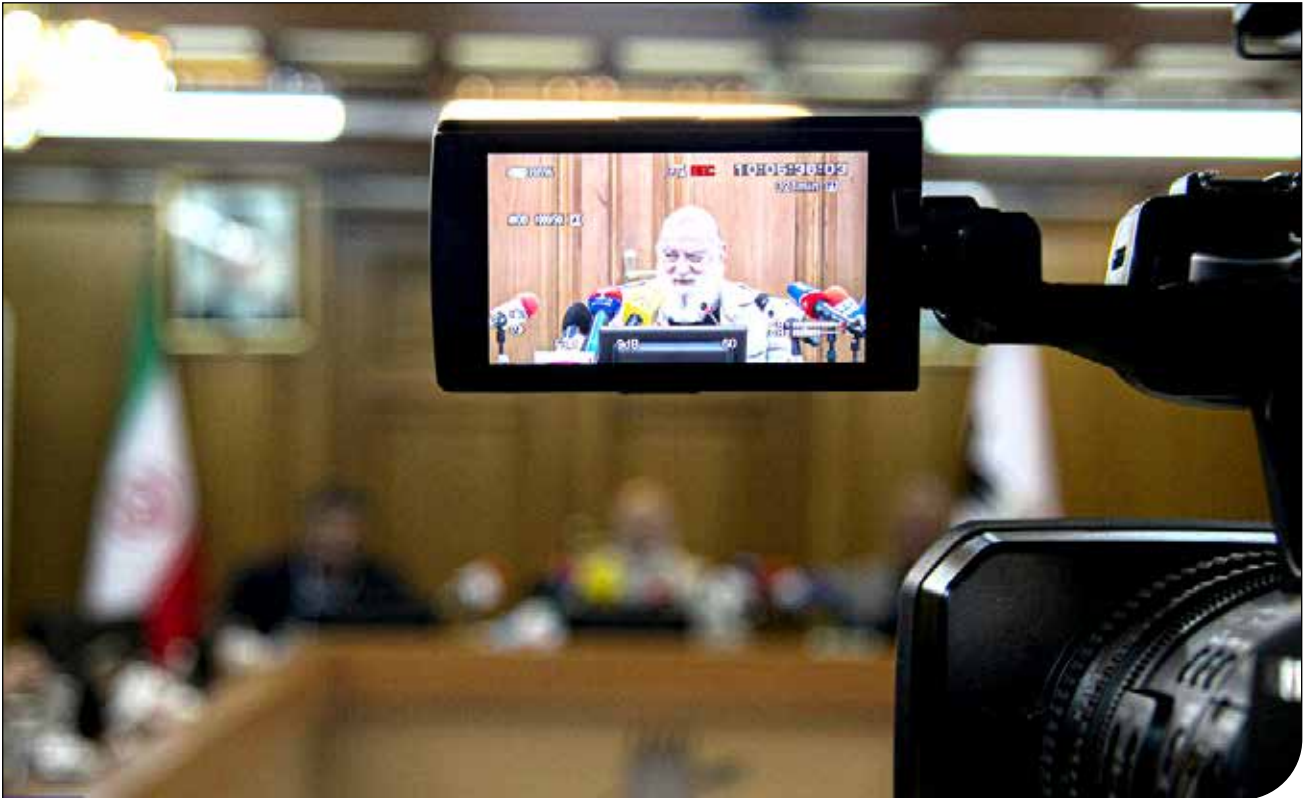
رئیس شورای شهر تهران در جریان برگزاری نشست خبری در محل ساختمان های پرخطر ملزم به ایمن سازی آنها