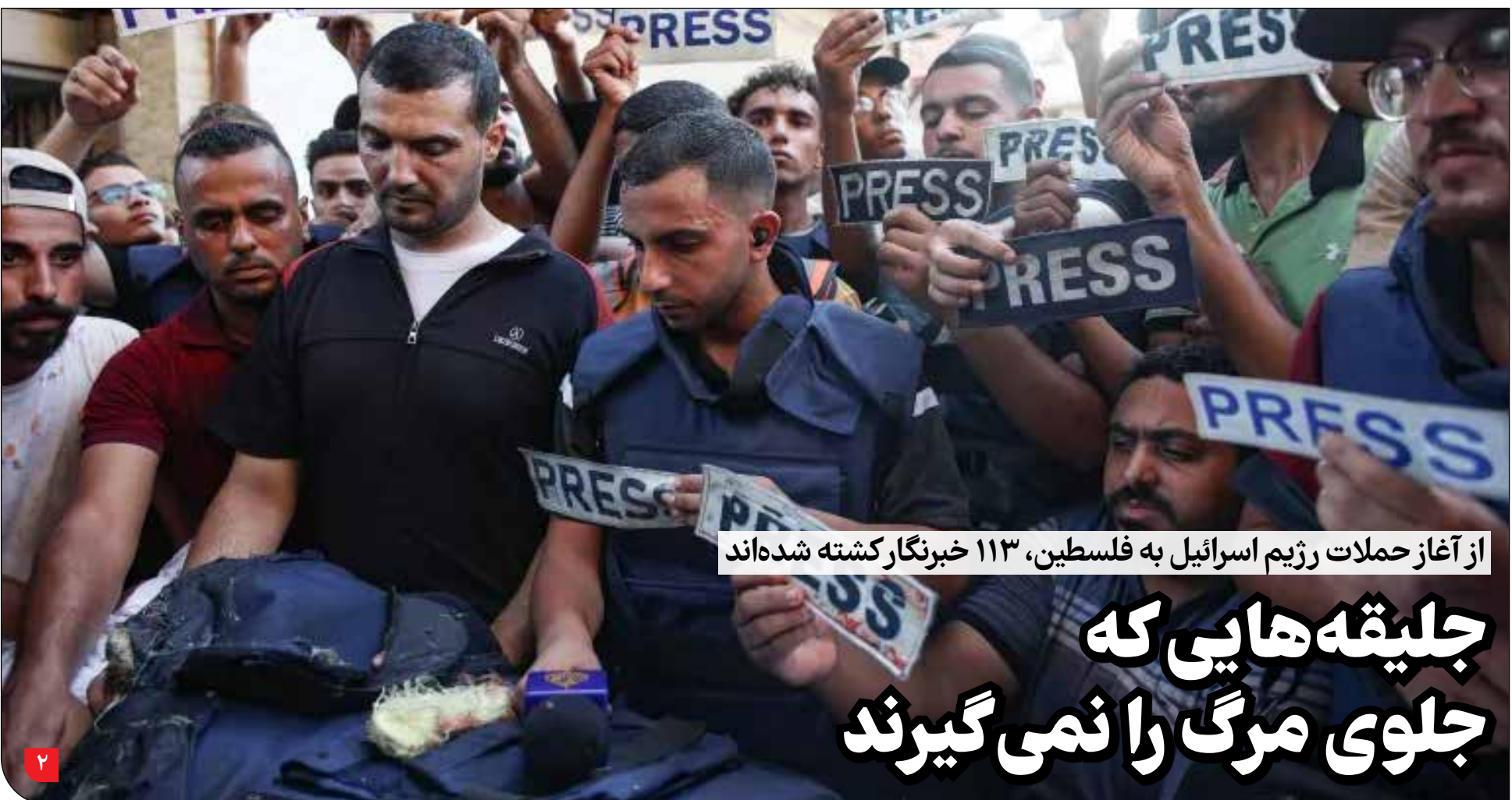
از آغاز حملات رژیم اسرائیل به فلسطین، ۱۱۳ خبرنگار کشته شده‌اند

مدیر روابط عمومی منابع طبیعی و آبخیزداری استان گیلان: جنگلبانان کوچک‌ترین سلاحی برای دفاع از خود ندارند