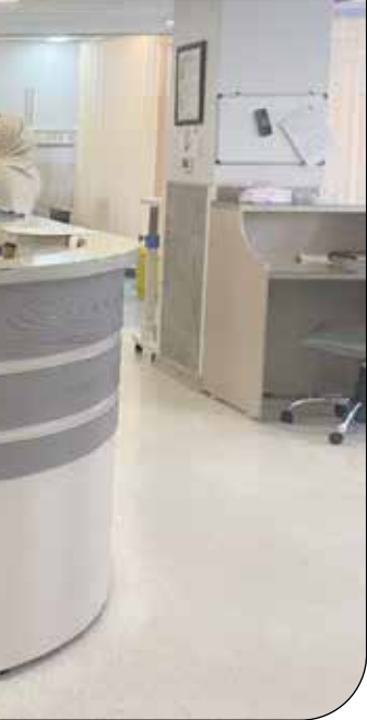
بیمارستان تهران کلینیک [۱۳۰]