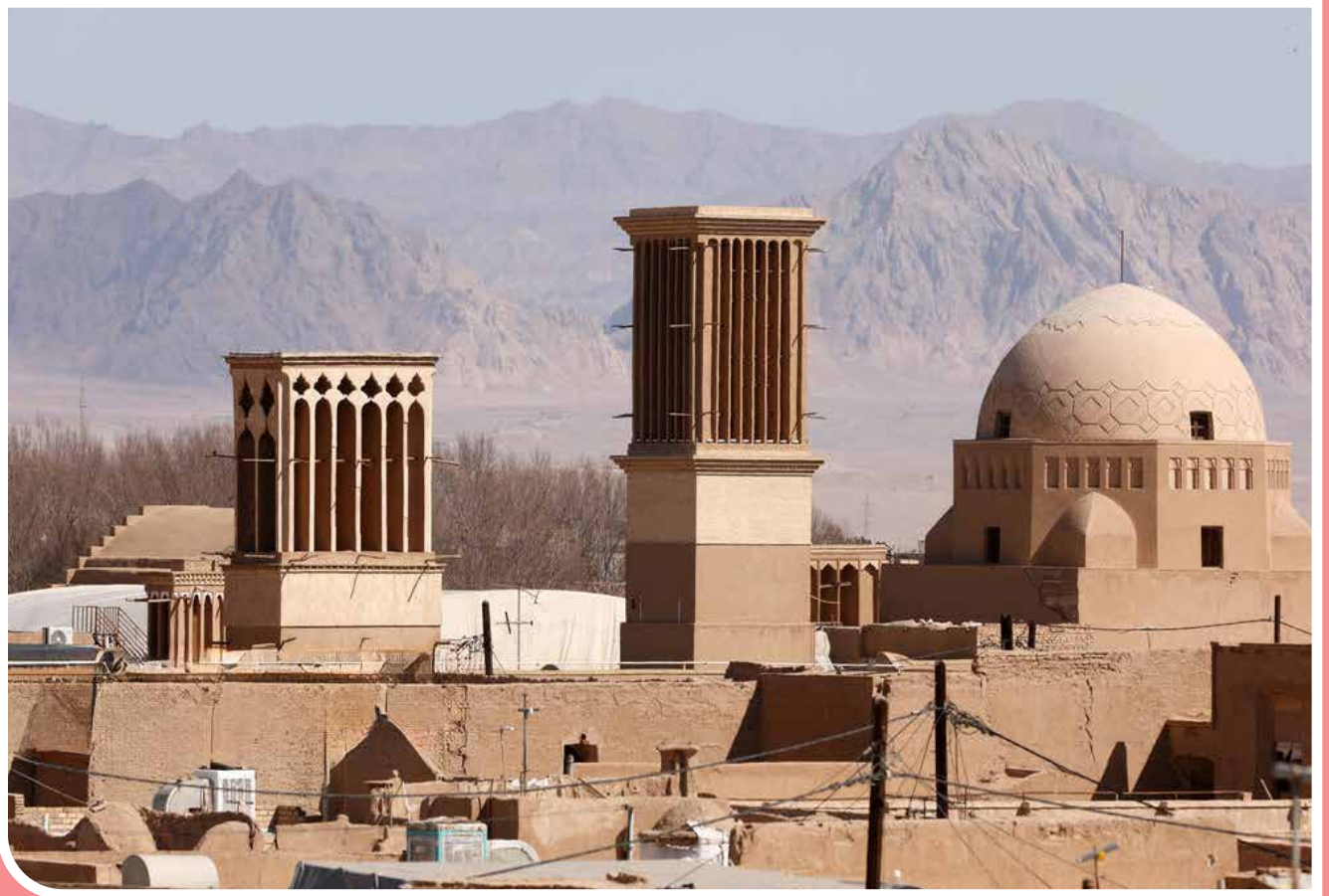
«بادگیرهای یزد» یکی از شاهکارهای مهندسی ایرانی است که بدون مصرف هیچ نوعی انرژی، نقش مهمی در تهویه فضای داخلی خانه‌ها داشته است. یزد به‌عنوان یکی از شهرهای تاریخی ایران، به بادگیرهای خود شهرت دارد. بادگیر در گذشته به‌عنوان راهکاری برای تحمل شرایط طاقت‌فرسای آب‌وهوای گرم‌وخشک در چنین منطقه‌ای اختراع شد.