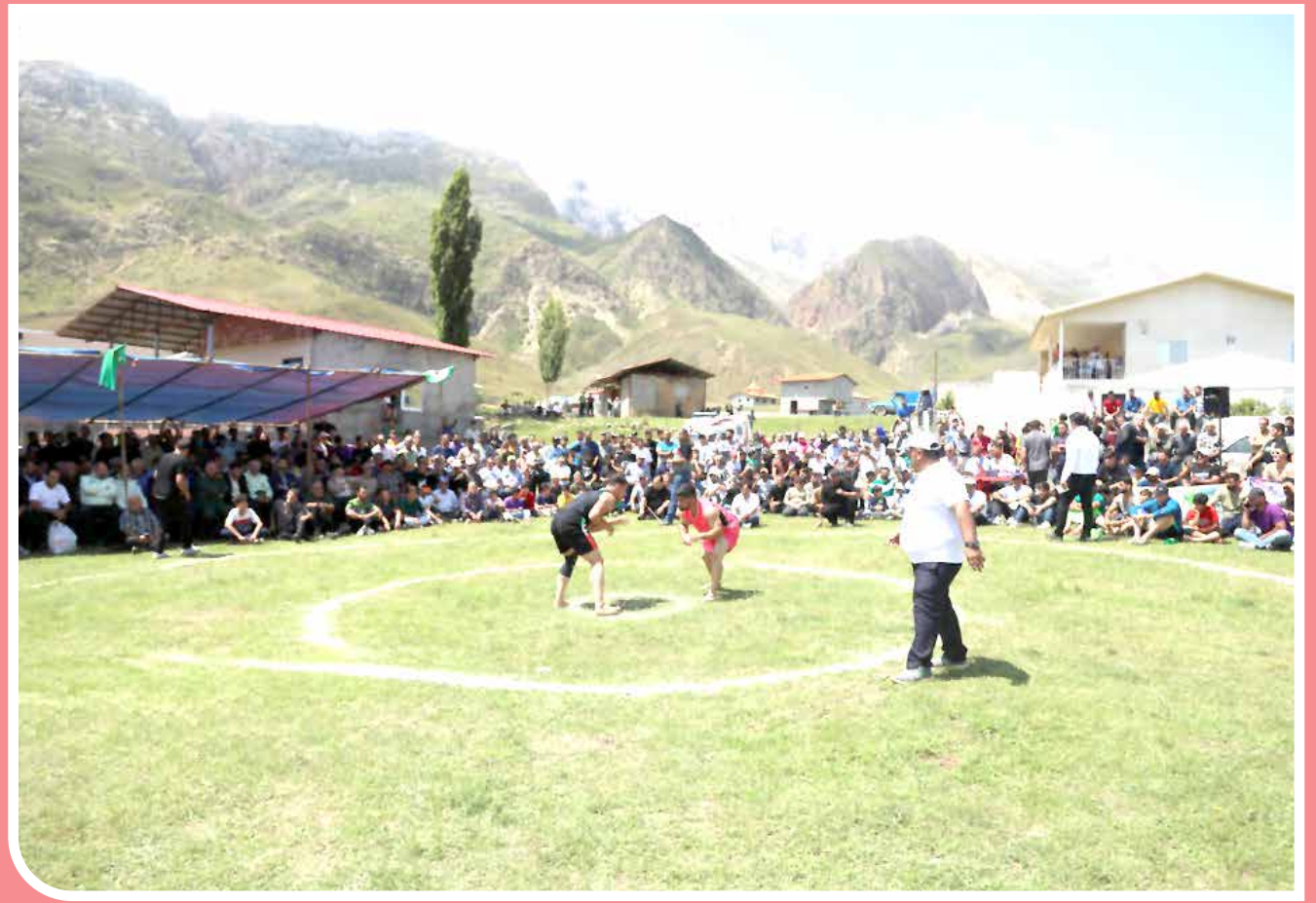
مسابقات کشتی لوجو در سوادکوه، یکی از کشتی‌های سنتی معروف کشور، ورزش پهلوانی «لوجو» در مازندران است. ورزشی که از گذشته در این منطقه برگزار شده و عده‌ای آن را به جشن «پایان برداشت برنج» و برخی آن را جشنی برای «تیرگان» می‌دانند. در این کشتی، هر یک از طرفین ورزشکار می‌کوشد تا یک یا چند نقطه از بدن حریف را به زمین بزند.