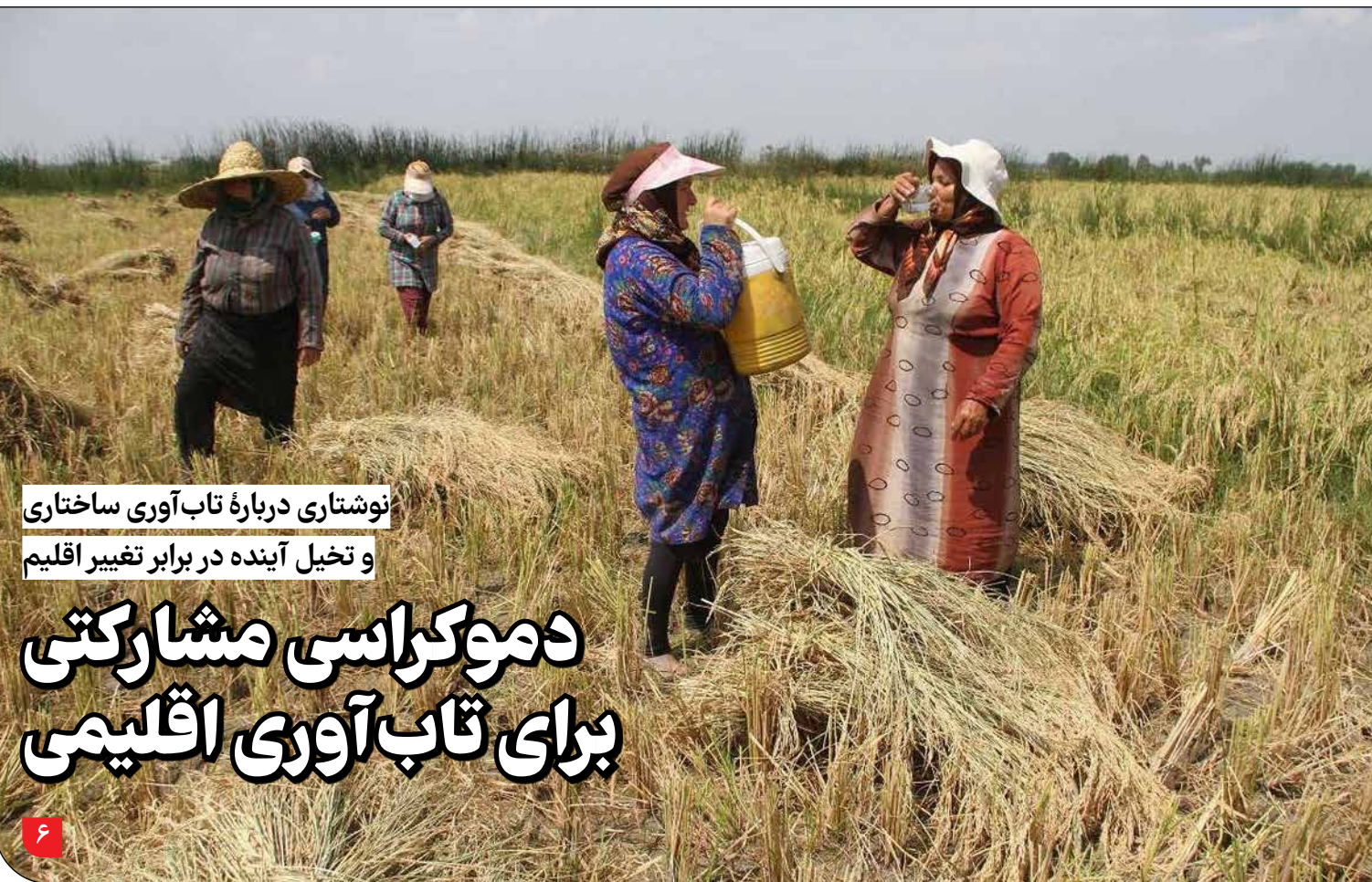
نوشتاری درباره تاب آوری ساختاری و تخيل آینده در برابر تغيير اقليم

وزیر نیرو پس از جلسه با مدیران ارشد صنعت برق از مردم خواست در مدیریت مصرف برق همکاری کنند