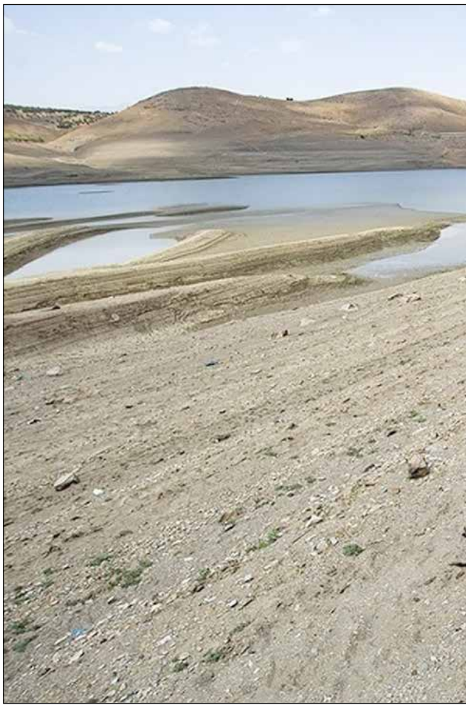
مهندسی عمران دانشگاه تهران

و اما مطلب اصلی و اینکه وزیر پیشنهادی چه اولویت‌هایی را باید در حوزهٔ آب مورد توجه قرار دهد؟ همانطور که گفته شد، اولین نکته‌ای که وزیر پیشنهادی باید از خود نشان دهد، تسلط بر مبنای جدید مدیریت و برنامه‌ریزی منابع آب و به‌رسمیت‌شناختن وظایف اکوسیستمی آن است. داشتن چنین دیدگاهی سبب چرخش جدی در برنامه‌های توسعه‌ای وزارتخانه خواهد شد. لذا با این پیش‌فرض، تنها یک وزیر قوی و مسلط که بتواند در مقابل همهٔ لابی‌ها، سیاسی‌کاری‌ها و زیاده‌خواهی‌ها بایستد و با نگاه ملی و پذیرفتن ریسک ازدست‌دادن میز وزارت، چرخش در برنامه‌ریزی‌ها را شروع کند، می‌تواند وزیری