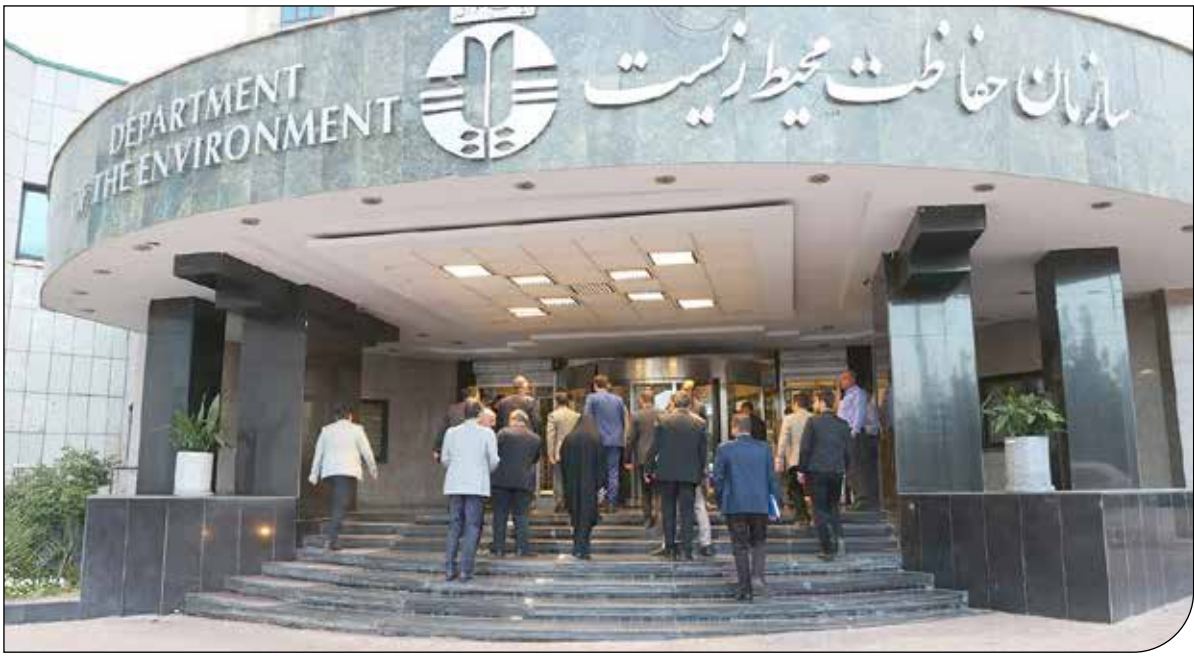
تهرانپیکتور | I