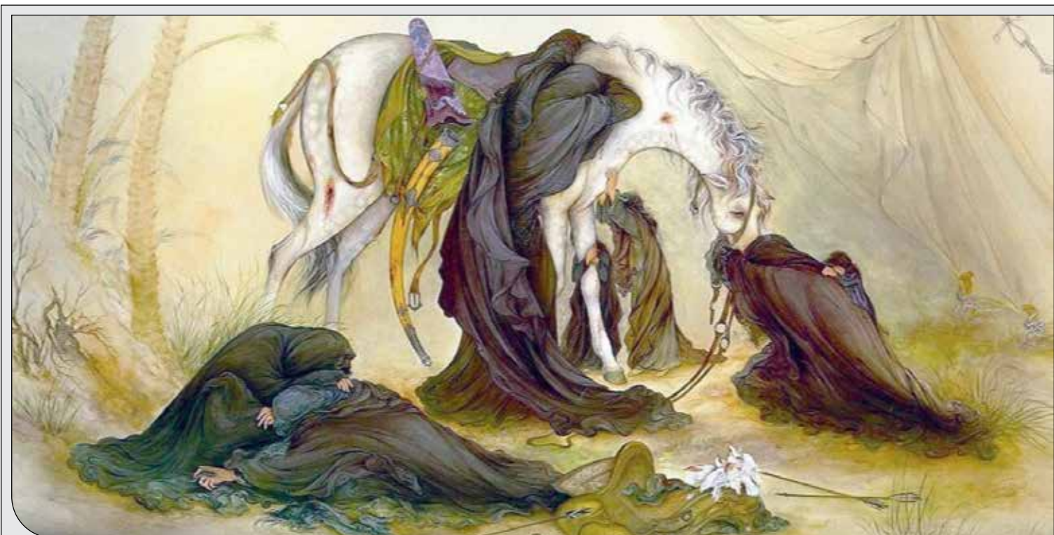
نگارگری مشهور «محمود فرشچیان» ۴۸ سال پس از خلق اثر به ثبت رسید

وضعیت بغرنج کنونی نشان می‌دهد که وزارت رفاه نیازمند اجرای سیاست‌های تامین اجتماعی چندلایه و کارآمد است