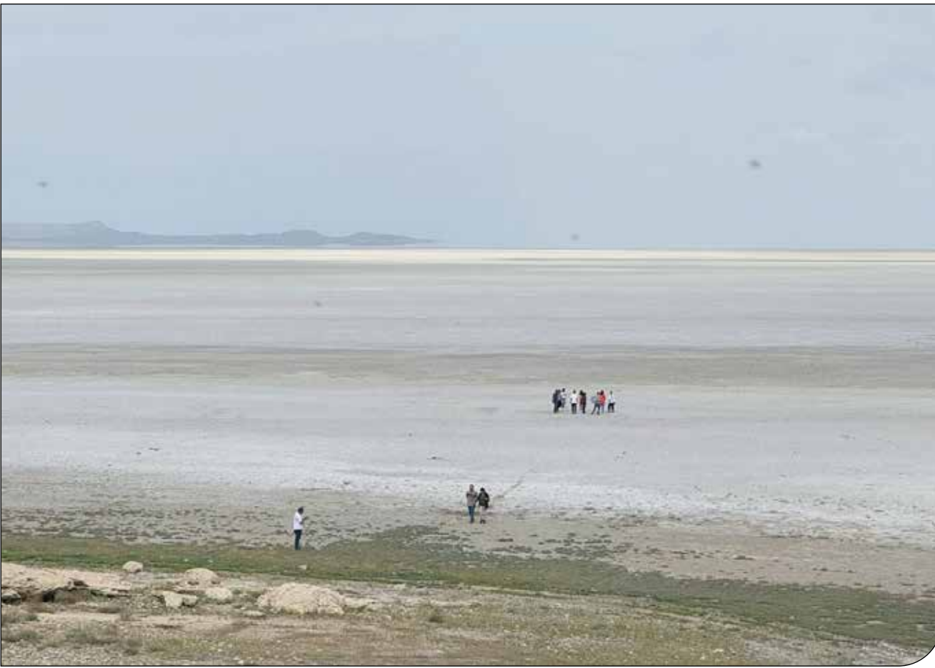
تالابها مسئله اول محیط زیست است

پیام ما در فاصله برگزاری دور دوم انتخابات ریاست‌جمهوری تا امروز، روزنامه «پیام ما» تلاش کرد تا با ارسال یک پرسشنامه نظرات افراد صاحب‌نظر در بخش‌های مختلف محیط‌زیست را درباره موضوعات مختلفی جویا شود. متأسفانه فرصت کوتاه باعث شد که جامعه آماری پاسخگویان تعداد بالایی نداشته باشد. با این حال در برخی از زمینه‌ها به نظر می‌رسد توافق نظر بسیاری بالایی درباره برخی اولویت‌ها بین پاسخگویان که از طیف‌ها و تخصص‌های مختلف محیط‌زیستی هستند، وجود دارد. در پیمایش انجام‌شده، ۲۶ نفری که پرسشنامه به آن‌ها ارسال شد، پاسخگوی سؤالات بودند؛ از این بین، ۲۳ نفر تحصیلات دانشگاهی مرتبط با محیط‌زیست دارند، ۶ نفر سابقه فعالیت به‌عنوان مدیر دولتی داشته و ۲۰ نفر دیگر سابقه کار در زمینه محیط‌زیست در قالب تشکلهای و یا کارشناسان مستقل را دارند.