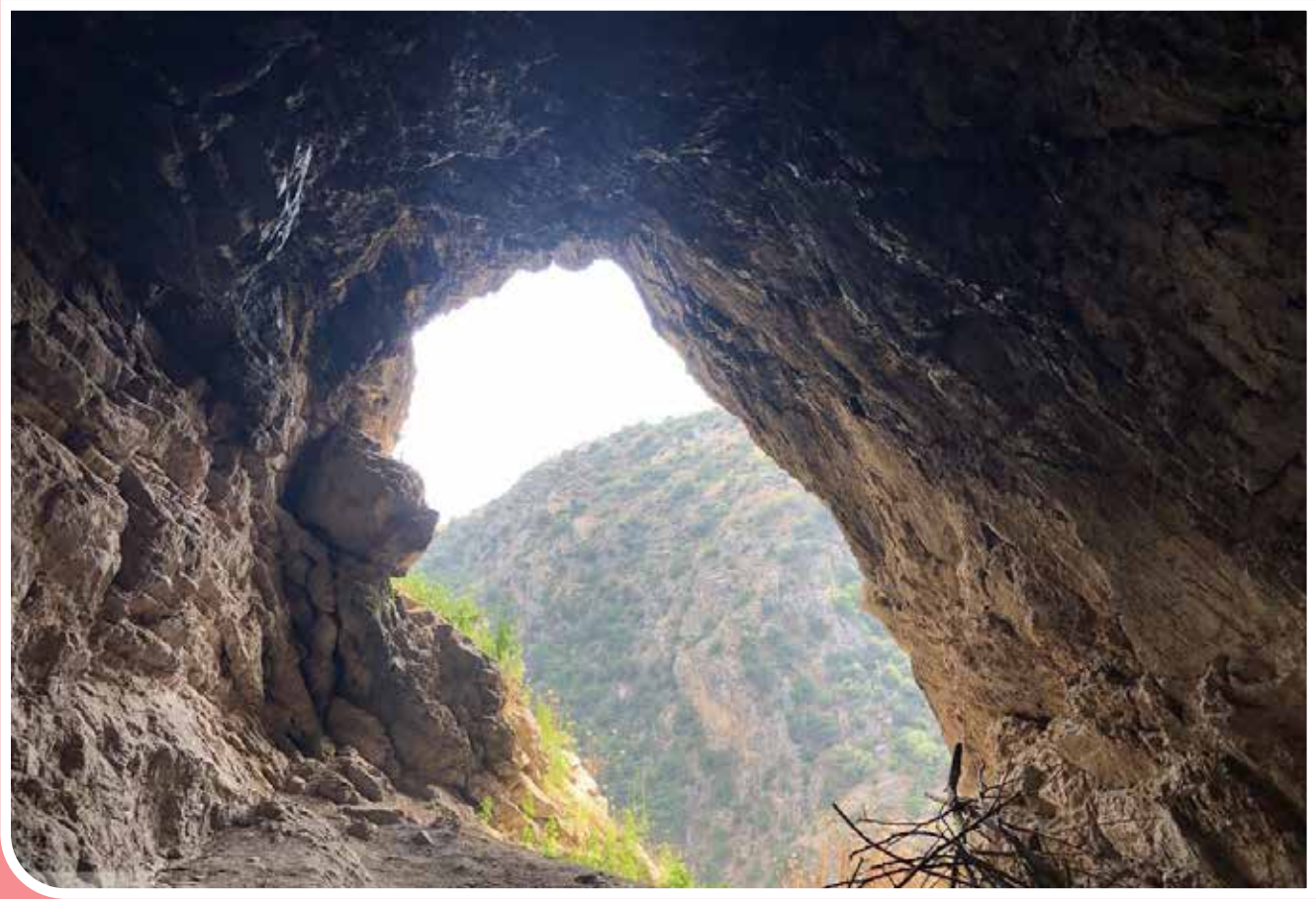
«فرنگ» روستایی از توابع بخش مرکزی شهرستان گالیکش در استان گلستان است. غار «درجفت» در فاصله سه کیلومتری روستای فرنگ قرار دارد. کف غار صخره‌ای بوده و نور کافی در داخل غار وجود ندارد؛ به طوری که تقریباً تا انتهای آن روشن نیست. سقف غار هم از جنس رسوبات سنگی آهکی است.