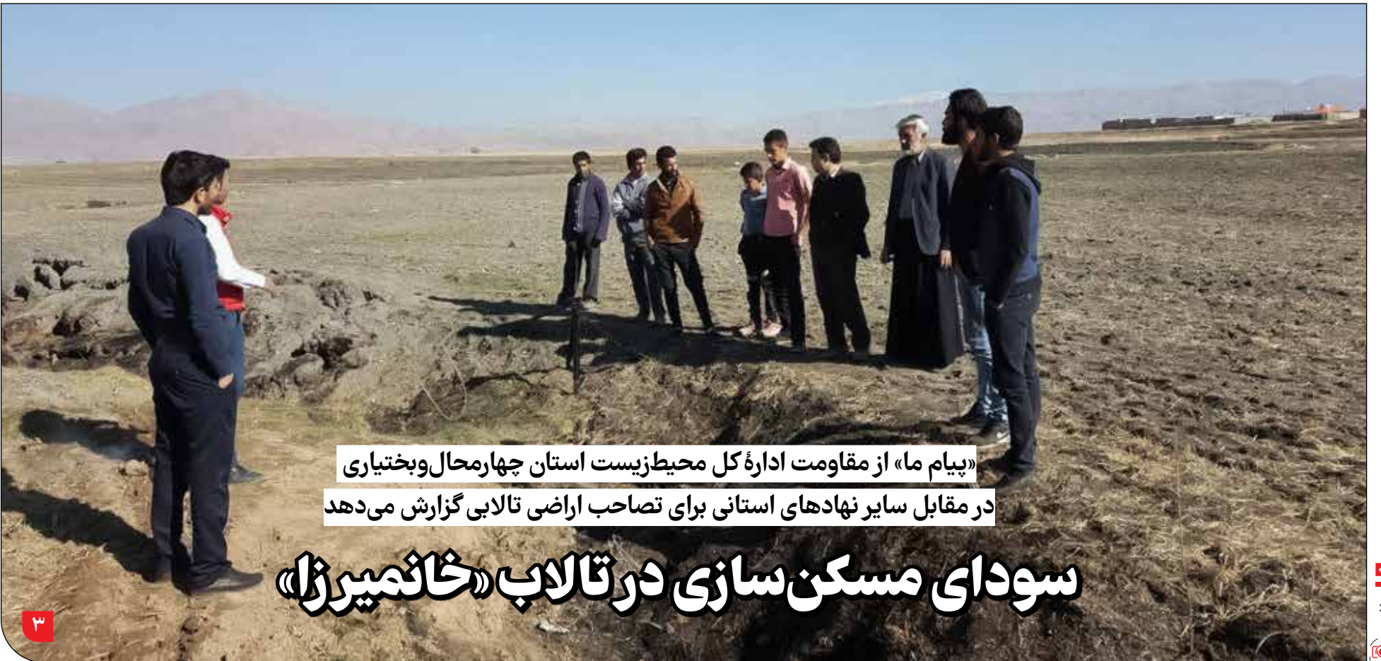
«پیام ما» از مقاومت اداره کل محیط‌زیست استان چهارمحال و بختیاری در مقابل سایر نهادهای استانی برای تصاحب اراضی تالابی گزارش می‌دهد

شرکت آب و فاضلاب کشور می‌گوید نتایج آزمایش آب مشکلی را نشان نمی‌دهد، علوم پزشکی هم می‌گوید جای نگرانی نیست