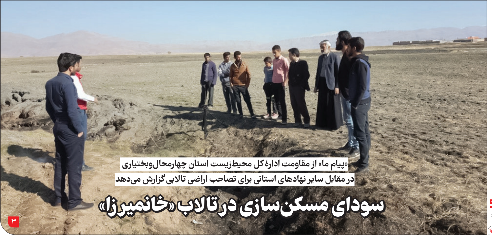
«پیام ما» از مقاومت اداره کل محیط‌زیست استان چهارمحال و بختیاری در مقابل سایر نهادهای استانی برای تصاحب اراضی تالابی گزارش می‌دهد

شرکت آب و فاضلاب کشور می‌گوید نتایج آزمایش آب مشکلی را نشان نمی‌دهد، علوم پزشکی هم می‌گوید جای نگرانی نیست