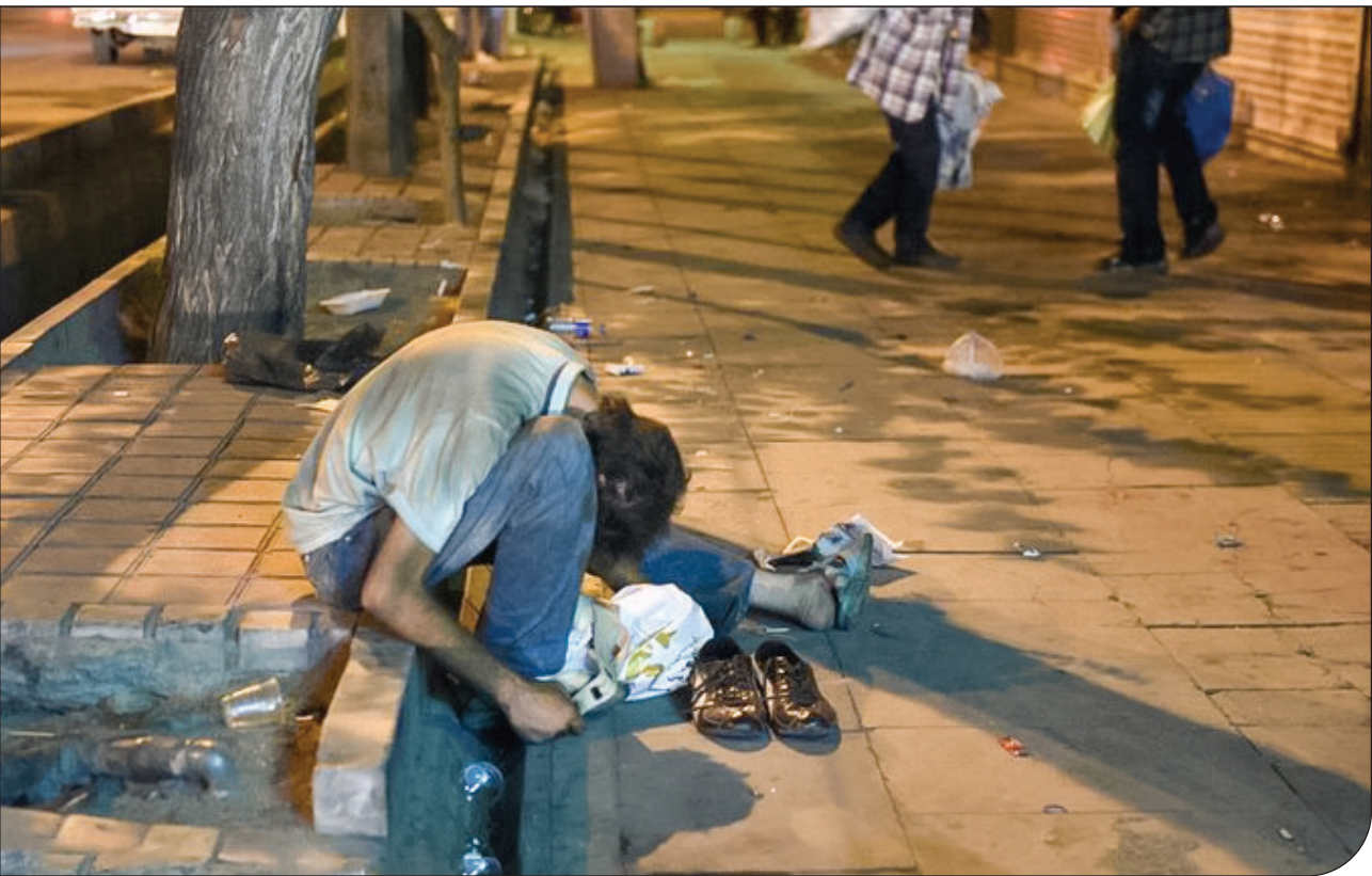
از اسس کشور تهران | [۱]

رئیس دفتر آموزش و ارتقاء سلامت وزارت بهداشت با اشاره به اینکه فقط یک درصد از بیماران فوت می‌کنند، تصریح کرد: معمولاً تب بیماری طی ۲ تا ۷ روز کنترل می‌شود و فروکش می‌کند و درمان بیماری، علامتی است. هنوز هیچ دارو و معجون گیاهی‌ای برای درمان قطعی بیماری کشف نشده است. پشه در تمام ساعات یک‌اندازه نمی‌گزد و شب‌ها بیشتر در آب‌های راکد تخم‌گذاری و روزها گزش را شروع می‌کند. در ساعات اولیه صبح و نزدیک غروب آفتاب، پشه آندس بیشترین گزش را دارد. او گفت: افراد برای پیشگیری از ابتلا به این بیماری، باید با پوشیدن لباس بلند و استفاده از مواد دافع حشرات از گزش مصون بمانند.