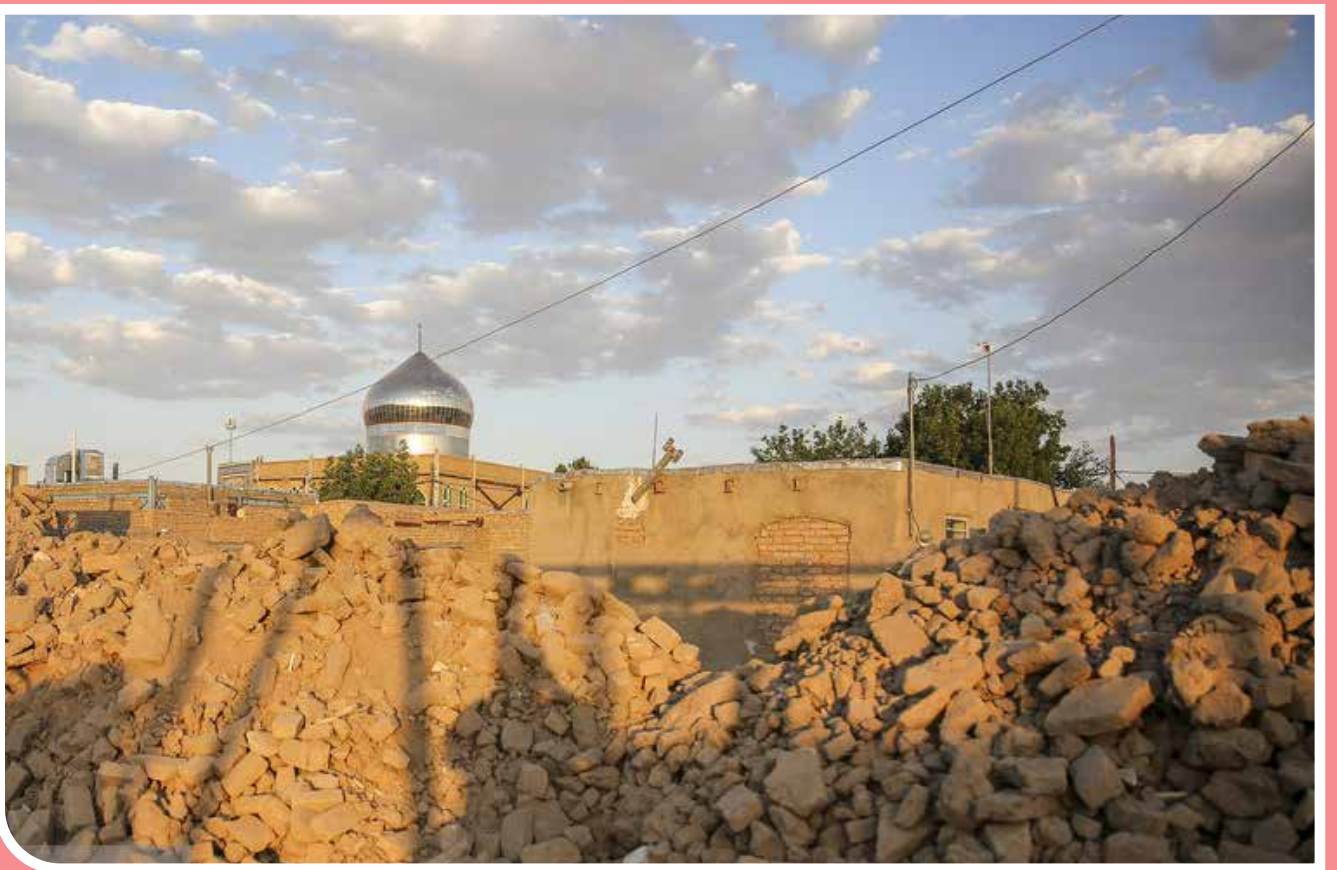
زلزله‌ای به بزرگی ۵ ریشتر سه‌شنبه ۲۹ خردادماه، شهرستان کاشمر در استان خراسان رضوی را لرزاند. این زلزله در عمق ۶ کیلومتری از سطح زمین رخ داده و در مناطق مختلفی از شهرستان کاشمر احساس شده است. متأسفانه این حادثه تاکنون ۴ نفر فوتی و حدود ۱۱۵ نفر مصدوم داشت است که ۳۵ نفر از حادثه‌دیدگان به صورت سرپایی مداوا شدند و وضعیت ۴ نفر از مصدومان این حادثه، طبق گزارش‌ها مساعد نیست.