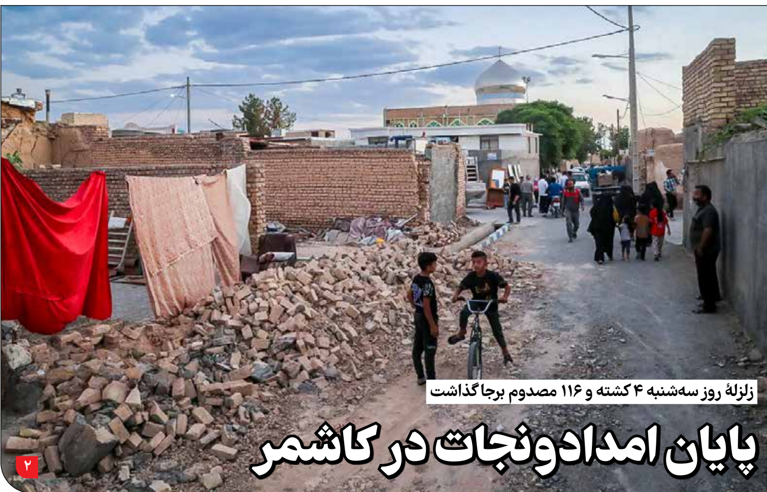
زلزله روز سه‌شنبه ۴ کشته و ۱۱۶ مصدوم برجا گذاشت

حفاظت‌گران از دانشمندان و ... خواسته‌اند که به جست‌وجوی پرندگانی بپردازند که برخی از آن‌ها حدود یک قرن است مشاهده نشده‌اند