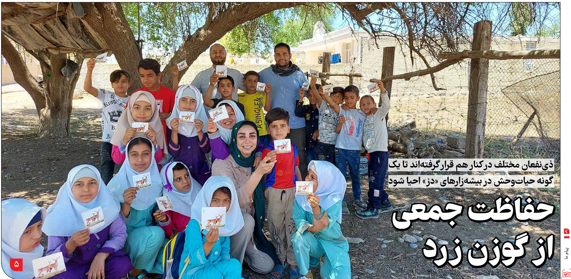
ذی نفعان مختلف در کنار هم قرار گرفته‌اند تا یک گونه حیات وحش در بیشه‌زارهای «دز» احیا شود

پس از اعلام اسامی کاندیداهای احراز صلاحیت‌شده، جبهه اصلاحات جلسهای فوق‌العاده برای حمایت از مسعود پزشکیان تشکیل داد