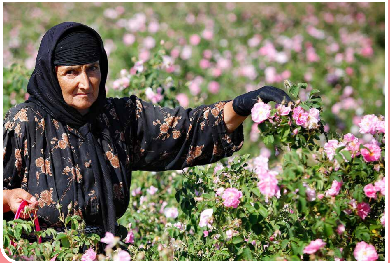
برداشت گل محمدی از خردادماه در مزارع استان همدان آغاز می‌شود. درحال حاضر، شهرستان ملایر و بهار بیشترین مزارع تحت کشت در سطح استان همدان را دارا هستند. این محصول به‌عنوان یکی از محصولات کم‌آب‌بر و دارای توجه اقتصادی بالا در ۲۶۰ هکتار از اراضی استان همدان کشت می‌شود.