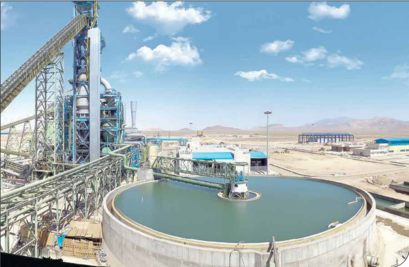
- اسفند ۱۴۰۳

سهم هر مترمکعب آب مصرفی در تولید ناخالص ملی در ایران کمتر از دو دلار است؛ درحالی‌که متوسط جهانی آن هشت دلار است