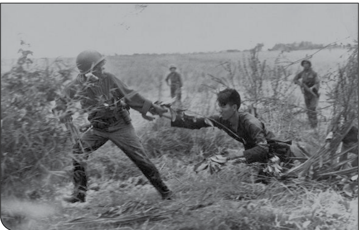
عکاسی به‌واسطه بازنمایی عین‌به‌عین از جهان بیرون، در همان آغاز اختراع خیلی زود به جهان رسانه‌ها وارد شد و سوئیچ استنادی آن سبب شد