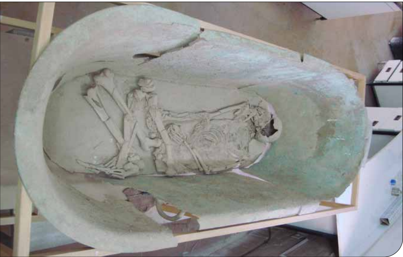
آخرین نظریه باستان‌شناسان درباره اسکلتی با تزئینات طلا بر چشم و دهان

هشدار زرد به‌معنای این است که پدیده‌ای جوی رخ خواهد داد که ممکن است در سفرها و انجام کارهای روزمره اختلالاتی ایجاد کند. این هشدار برای آگاهی مردم صادر می‌شود تا بتوانند آمادگی لازم را برای مواجهه با پدیده‌ای جوی داشته باشند که از حالت معمول کمی شدت بیشتری دارد. از سوی دیگر مسئولان نیز در جریان این هشدارها قرار می‌گیرند تا اگر لازم باشد، تمهیداتی ببندیدند.