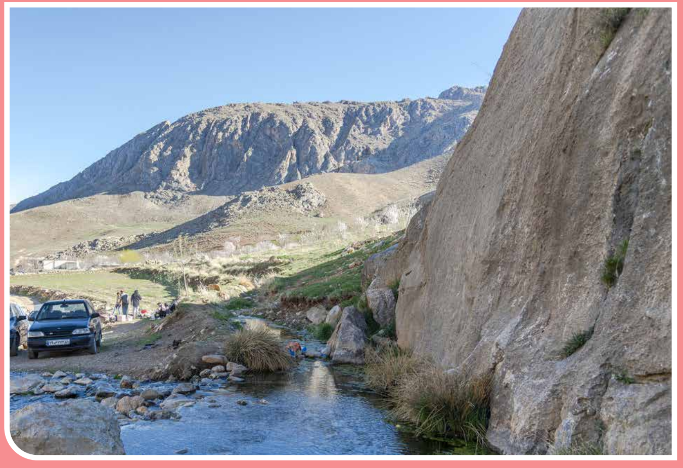
«چشمه مایک» یا «چشمه ماهک» از جاذبه‌های طبیعی استان چهارمحال و بختیاری است که همه‌ساله پذیرای گردشگران و مسافران زیادی است. اما متأسفانه به دلیل ناهمواری در منطقه امکانات رفاهی هنوز در این مکان پیشرفت نداشته است.