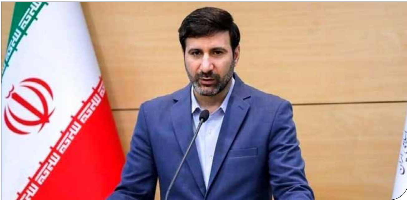
— ۳ —