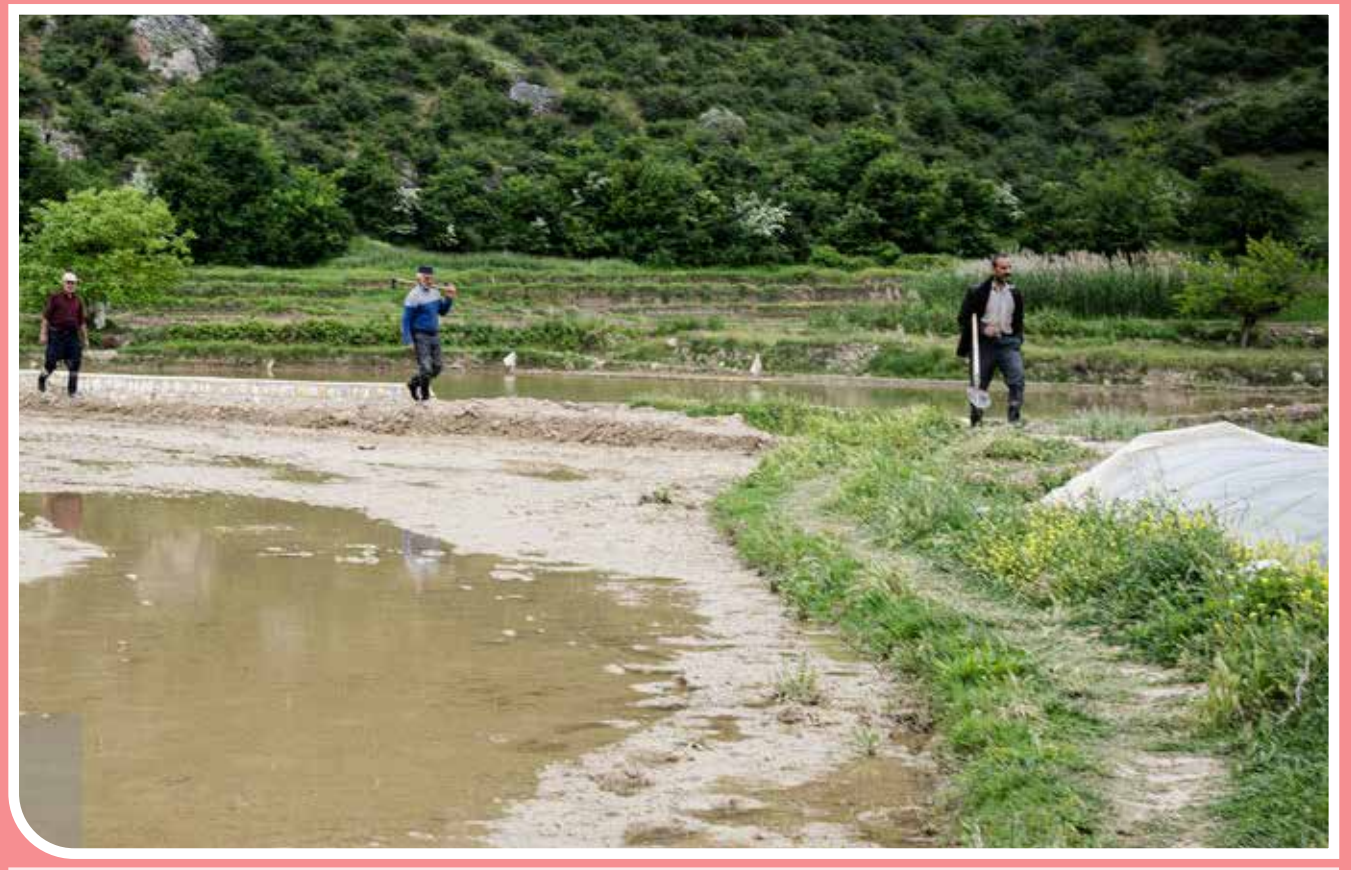
روستای «سفیدچاه» در شهرستان گلگاه بهشهر به‌عنوان یکی از آثار ملی ایران به ثبت رسیده است. براساس تحقیقاتی که بر روی خاک قبرستان سفیدچاه انجام شده، آهک موجود در خاک این قبرستان بسیار بالا است، به‌نوعی که رنگ خاک آن به سفیدی می‌زند. وجود این خاک آهکی سفید باعث تأخیر در فاسد شدن اجساد در این قبرستان می‌شود. همچنین، گفته می‌شود دلیل نامگذاری این مکان با نام قبرستان سپید نیز وجود همین خاک سفیدرنگ است. جدای از گورستان، روستای سفیدچاه جاذبه‌های دیدنی فراوانی مثل رود شمشیربر، مزارع کشاورزی و خانه‌های روستایی دارد.