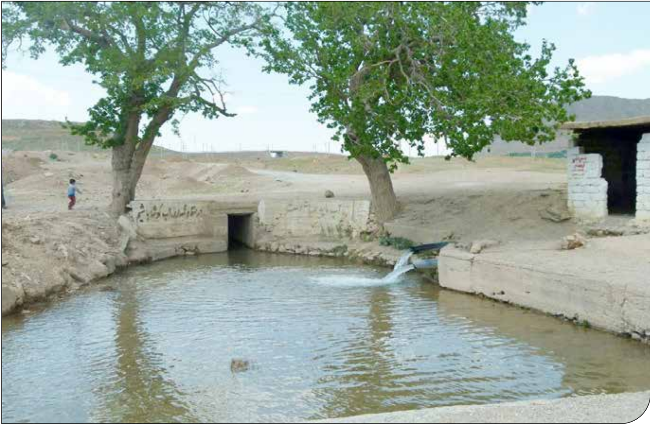
تنگنای اصلی حوزهٔ آب، نظام حکمرانی و تعامل دولت و جامعه است.

انوش نوری اسفندیاری، پژوهشگر سیاستگذاری آب: تنگنای اصلی حوزهٔ آب، نظام حکمرانی و تعامل دولت و جامعه است، نه افزایش بودجه