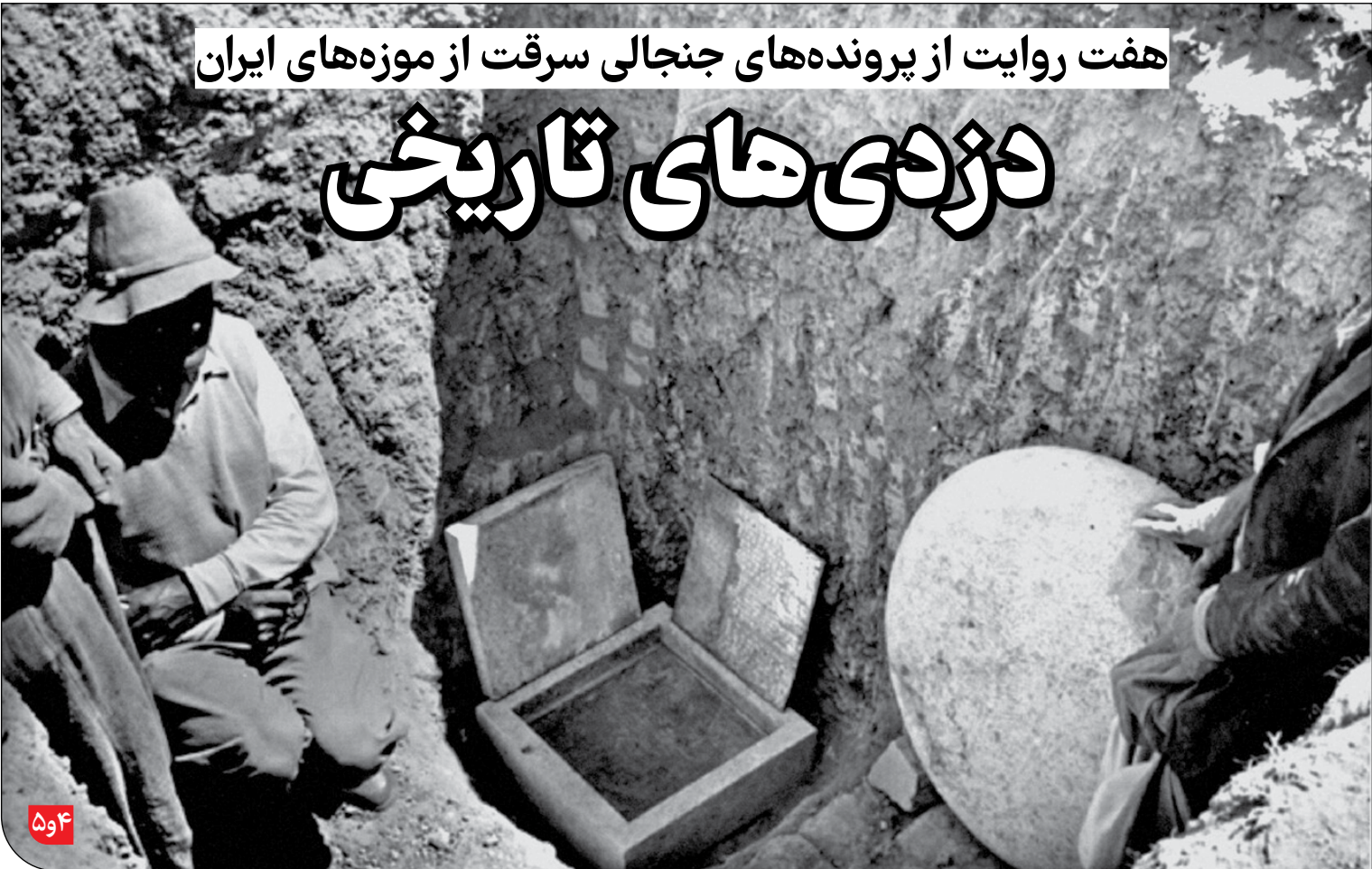
هفت روایت از پرونده‌های جنجالی سرقت از موزه‌های ایران