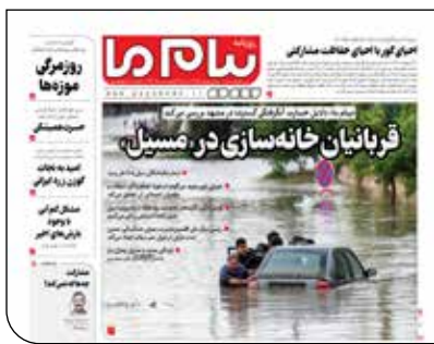
پیام ما دیروز