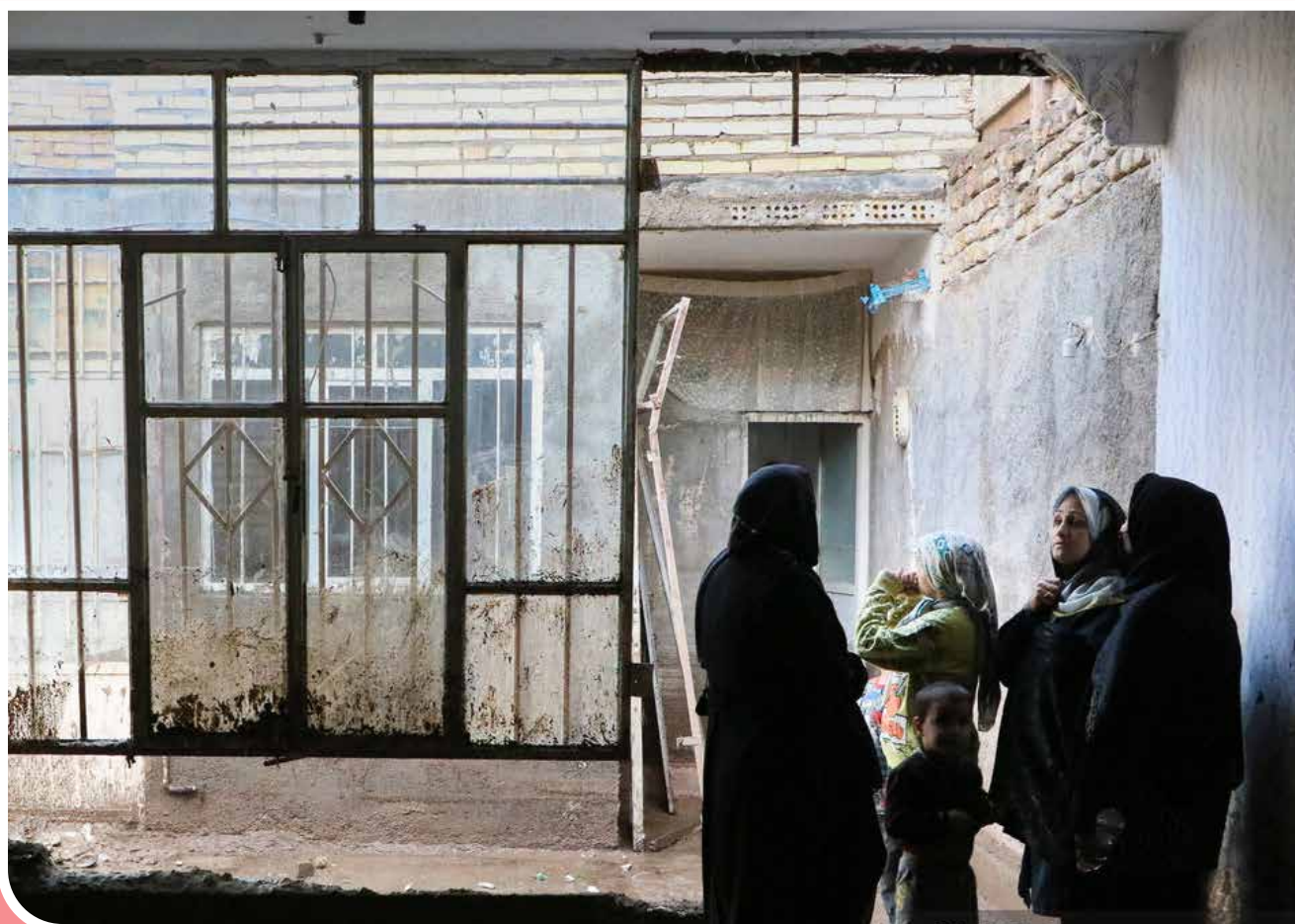
پس از گذشت چندروز از سیل مشهد، زندگی مردم مناطقی از این کلانشهر همچنان به شرایط عادی بازنگشته است.