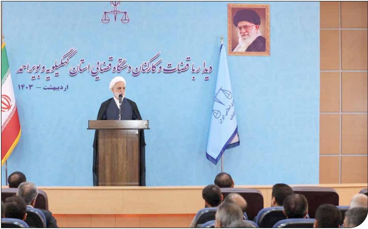
— تهران — [ویدئو]

۴۵ نفر در رابطه با چای دیش تفهیم اتهام شده‌اند