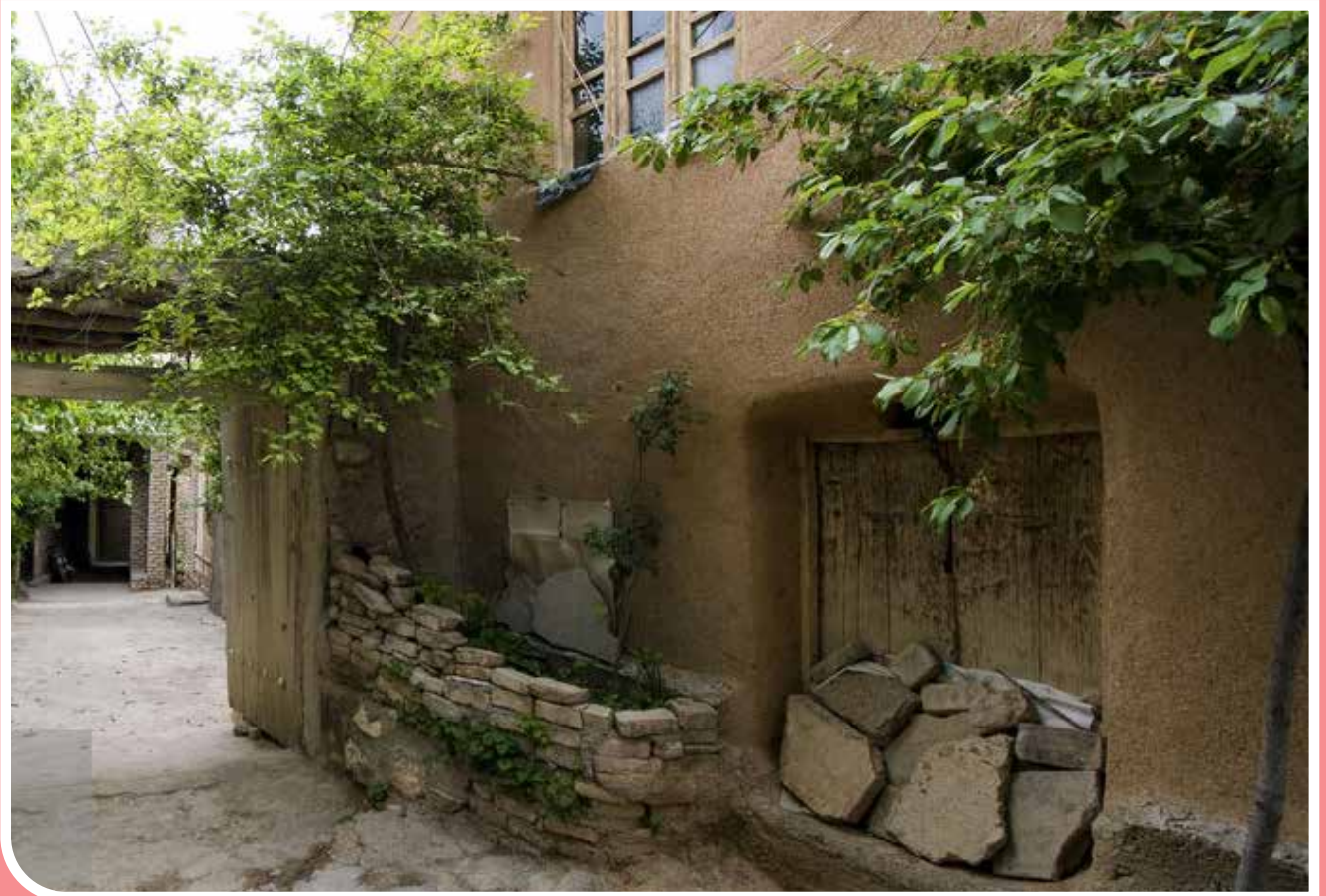
«روئین» نام روستایی در دل کوه‌ها و باغ‌های سرسبز استان خراسان شمالی است. خانه‌های بافت تاریخی روستا از سنگ، چوب و خشت است و سقف بسیاری از خانه‌ها، کوجهایی دالان‌مانند را به وجود آورده است. این روستا در فاصله ۵۲ کیلومتری جنوب شهرستان بجنورد واقع شده است.