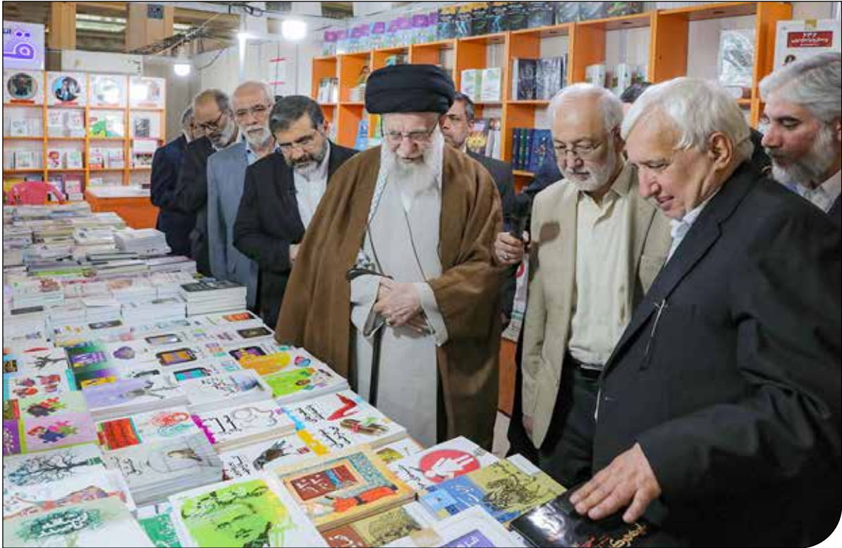
— Rahnemair —

فارغ از همهٔ موارد آبی‌شویی و سبزشویی و… در درازمدت سبب بی‌اعتمادی افکار عمومی و مصرف‌کنندگان نسبت به همهٔ برنامه‌های اجتماعی و اقتصادی و محیط‌زیستی و… می‌شود که آسیب‌های فراوانی به جوامع تحمیل خواهند کرد.