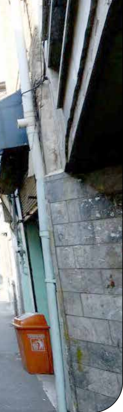
— تصویر عمده —