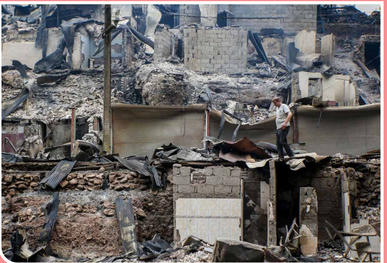
آتش سوزی بامداد پنجشنبه، سیزدهم اردیبهشت‌ماه، در روستای گردشگری امامزاده ابراهیم شفت واقع در غرب گیلان منجر به خسارت گسترده و از بین رفتن ۱۲۰ خانه، مغازه و واحد اقامتی شد. این روستا به دلیل وجود ساختمان‌های زیبا، رنگارنگ و چوبی چندین طبقه و چشمه‌های بکر همه ساله در بهار و تابستان میزبان گردشگران و زائران بوده است