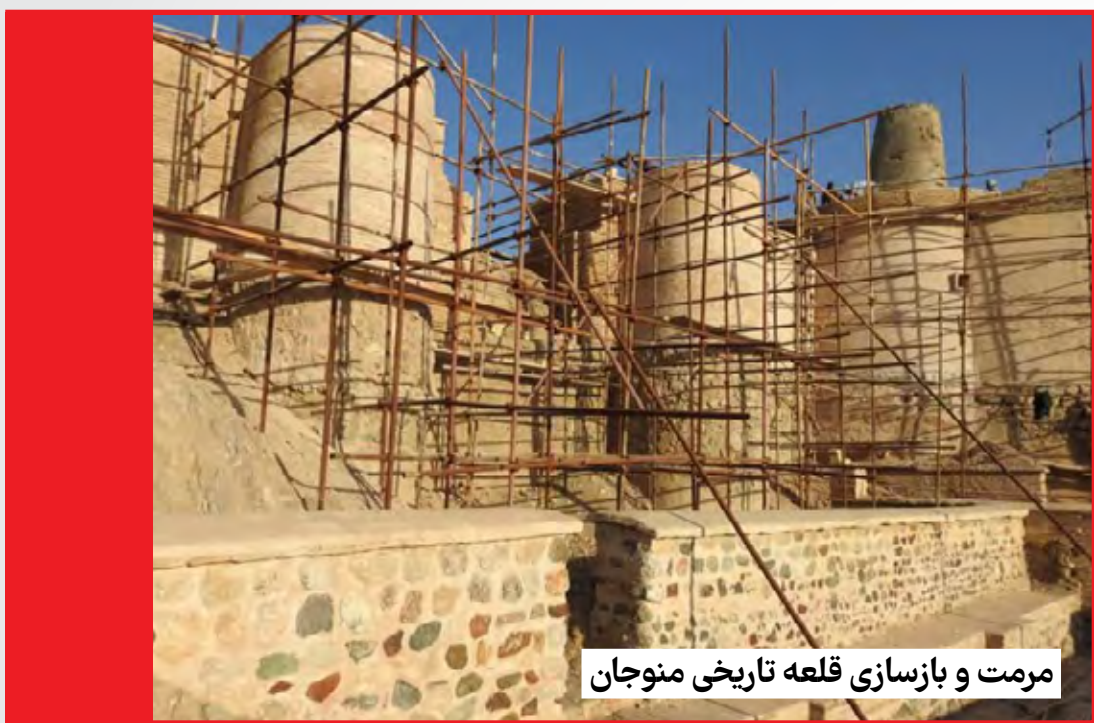
مرمت و بازسازی قلعه تاریخی منوجان