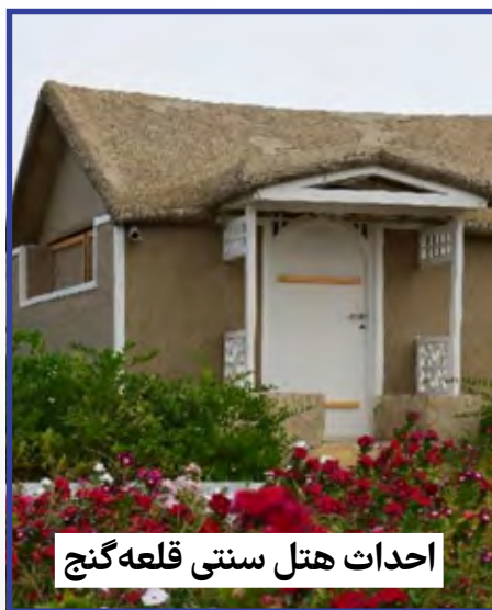
احداث هتل سنتی قلعه گنج