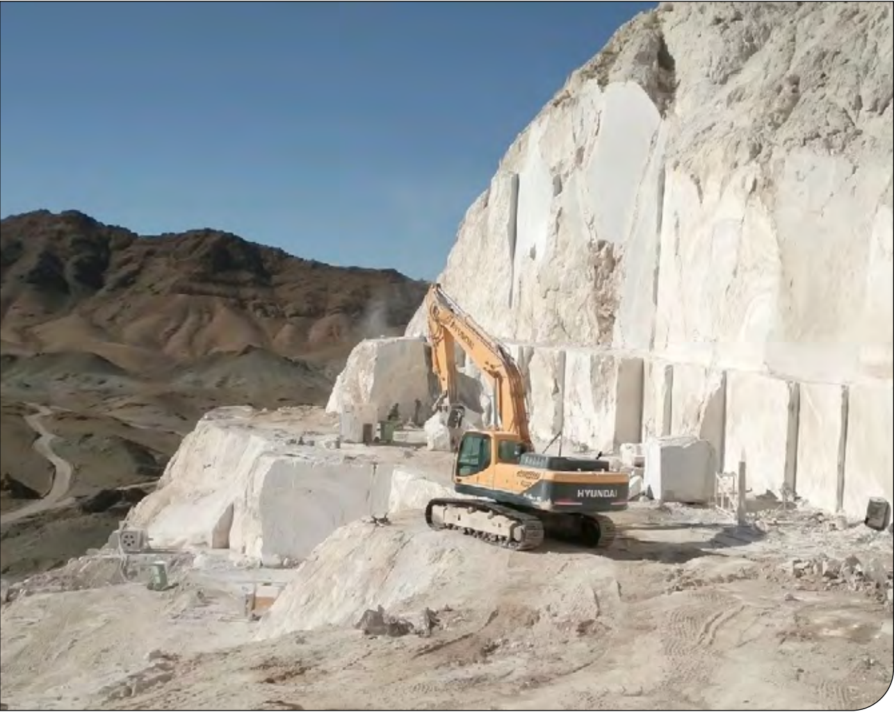
ایران | 10

حقوقدانان در گفت‌وگو با پیام ما بررسی کردند