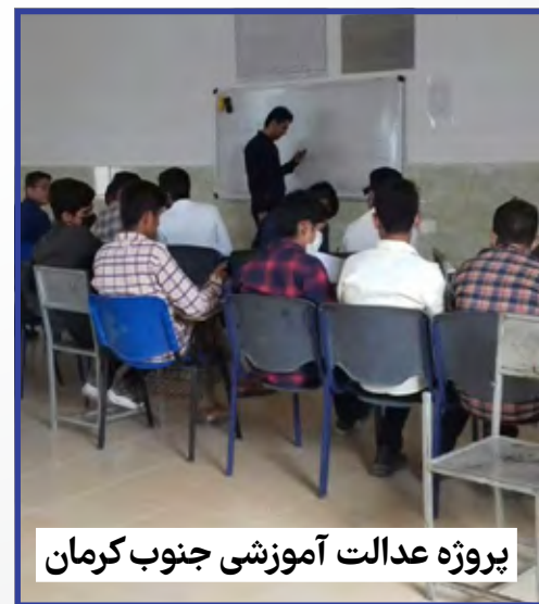
پروژه عدالت آموزشی جنوب کرمان