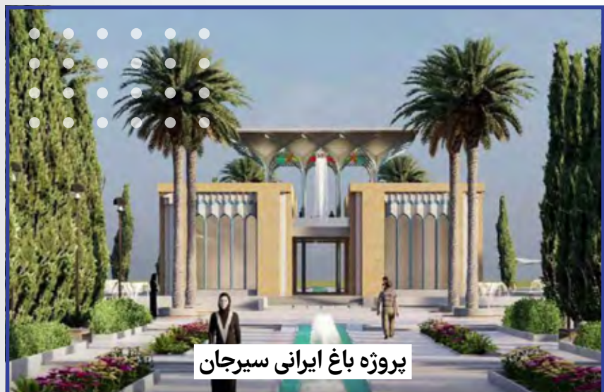
پروژه باغ ایرانی سیرجان