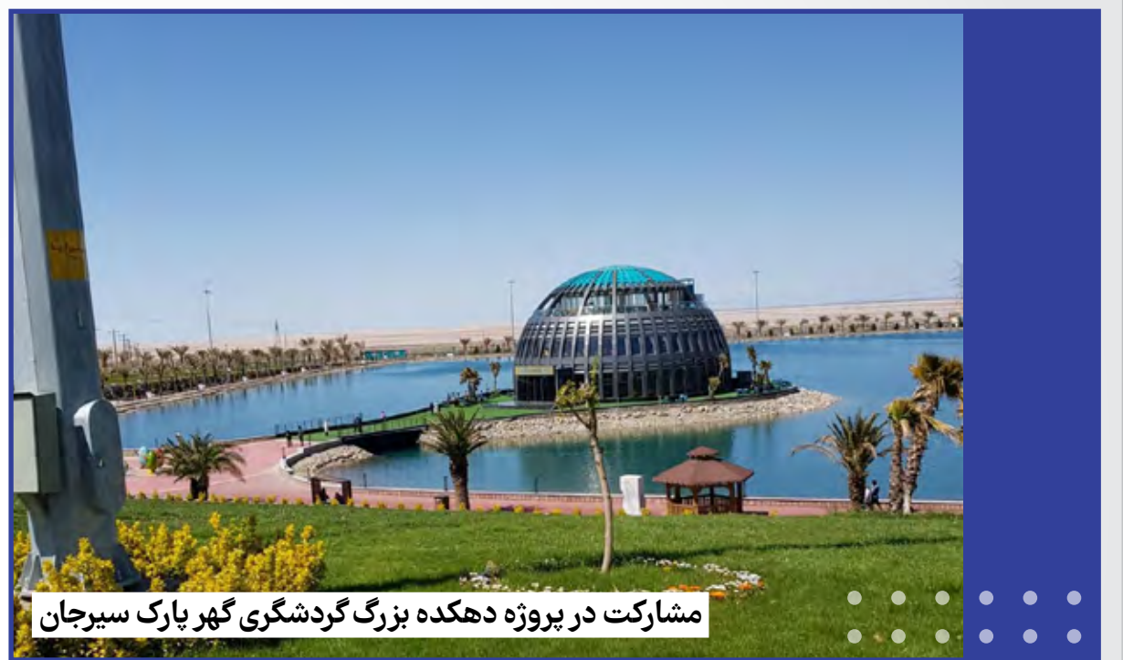
مشارکت در پروژه دهکده بزرگ گردشگری گهر پارک سیرجان