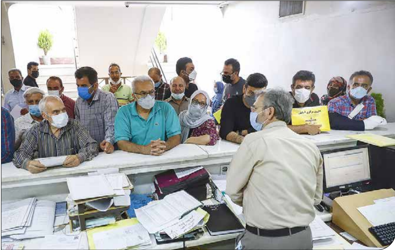
گروه پژوهشی تپله

معاون آموزش ابتدایی آموزش و پرورش گیلان در مورد نقش دیگر نهادهای حمایتی در پیشگیری از ترک تحصیل دانش‌آموزان افزود: براساس تفاهم‌نامه وزارت برای پیگیری وضعیت بازماندگان از تحصیل در سطح کشور سازمان‌هایی مانند اداره تعاون کار و رفاه اجتماعی، بهزیستی، کمیته امداد، علوم پزشکی، استانداری و غیره به عنوان شرکای آموزش و پرورش ملزم به همکاری هستند. او درباره نقش آفرینی سازمان‌ها گفت: اداره کار با اعطای بسته‌های حمایتی مالی و معیشتی به خانواده‌های دارای فقر مالی، بهزیستی با کمک به کودکان با بیماری‌های خاص و همچنین حمایت از کودکان بدسرپرست و بی‌سرپرست، دادگستری با حمایت قضایی از کودکان بدسرپرست و بی‌سرپرست، ثبت احوال با کمک برای ثبت مشخصات و دریافت شناسنامه برای ایجاد هویت و ثبت نام در سامانه‌های آموزشی و کمک به ادامه تحصیل دانش‌آموزان، پای کار هستند تا هیچ دانش‌آموزی از تحصیل باز نماند.