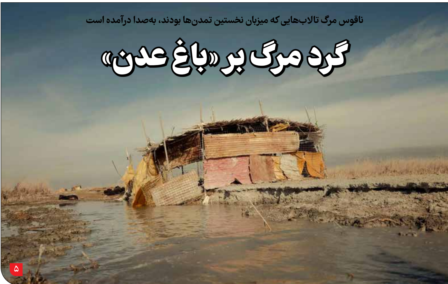
ناقوس مرگ تالاب‌هایی که میزبان نخستین تمدن‌ها بودند، به صدا درآمده است

پروندهٔ ساخت یک آغل جدید توسط افرادی که دامدار نیستند به دادگاه ارسال شد