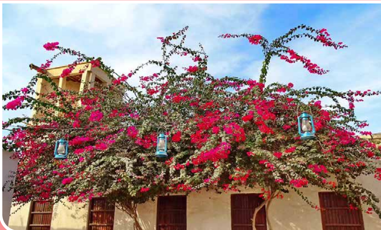
بندر «کنگ» یکی از قدیمی‌ترین بنادر ایران در پنج کیلومتری شهر بندر «لنگه» قرار دارد. این بندر حدود ۶.۵ کیلومترمربع مساحت دارد. حدود ۱.۹۵ کیلومترمربع از آن جزو بافت تاریخی و بقیه بافت توسعه‌یافته است. از جمله ویژگی‌های بافت تاریخی بندر کنگ می‌توان به معماری ارزمنند آن، خانه‌های قدیمی با بادگیرهای زیبا و کوچک‌های باریک و سایه‌انداز اشاره کرد